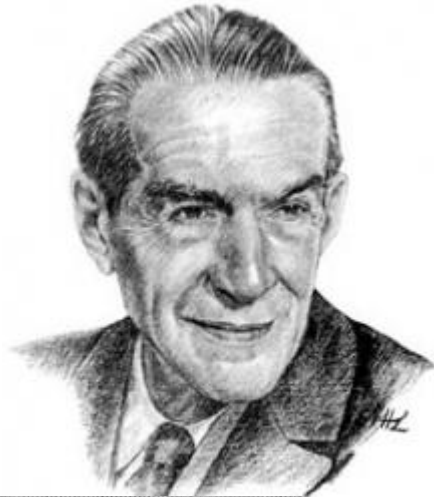
С. Л. Рубинштейн