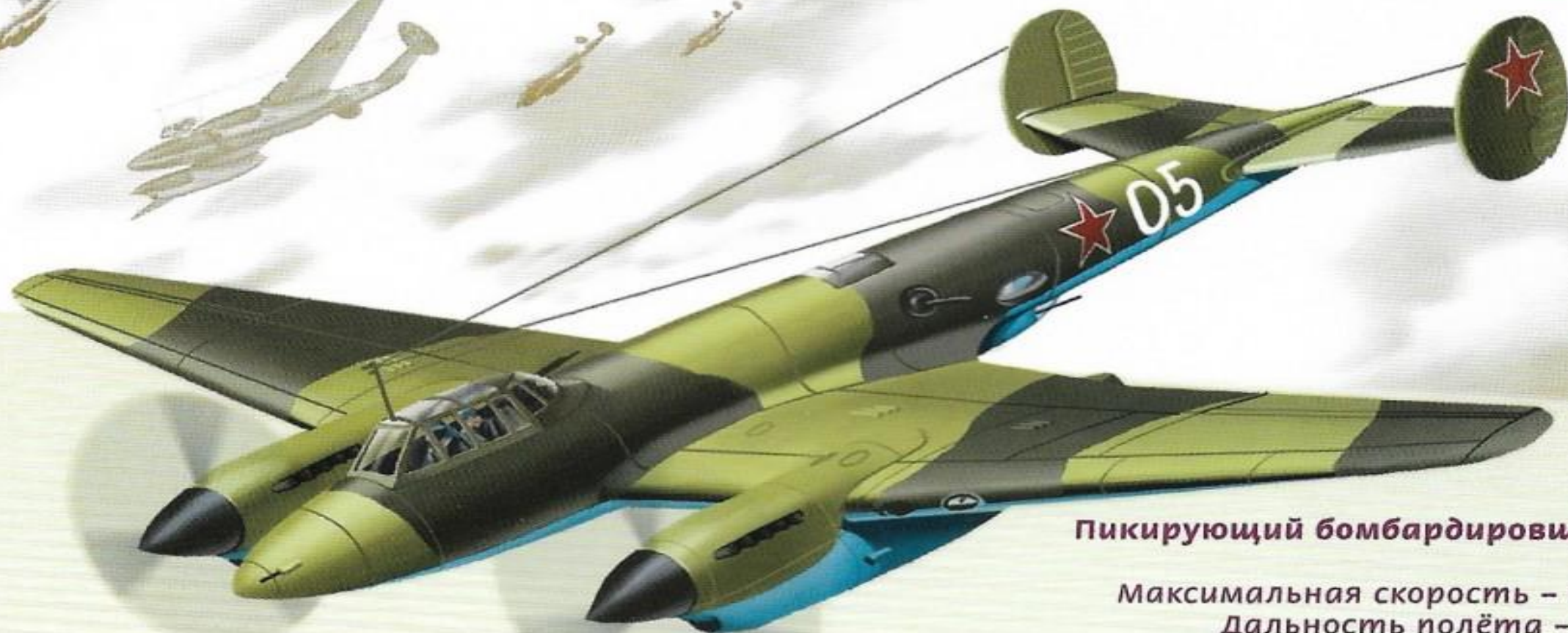
Пикирующий бомбардировщик Пе-2