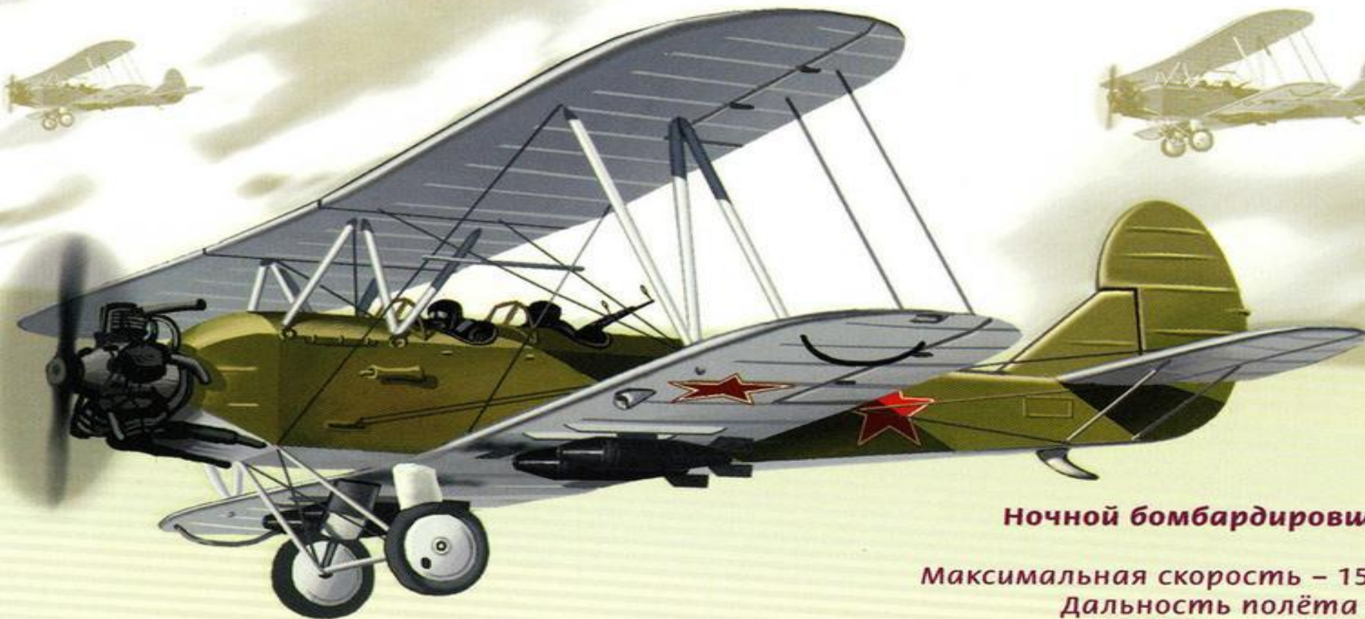
Ночной бомбардировщик По-2