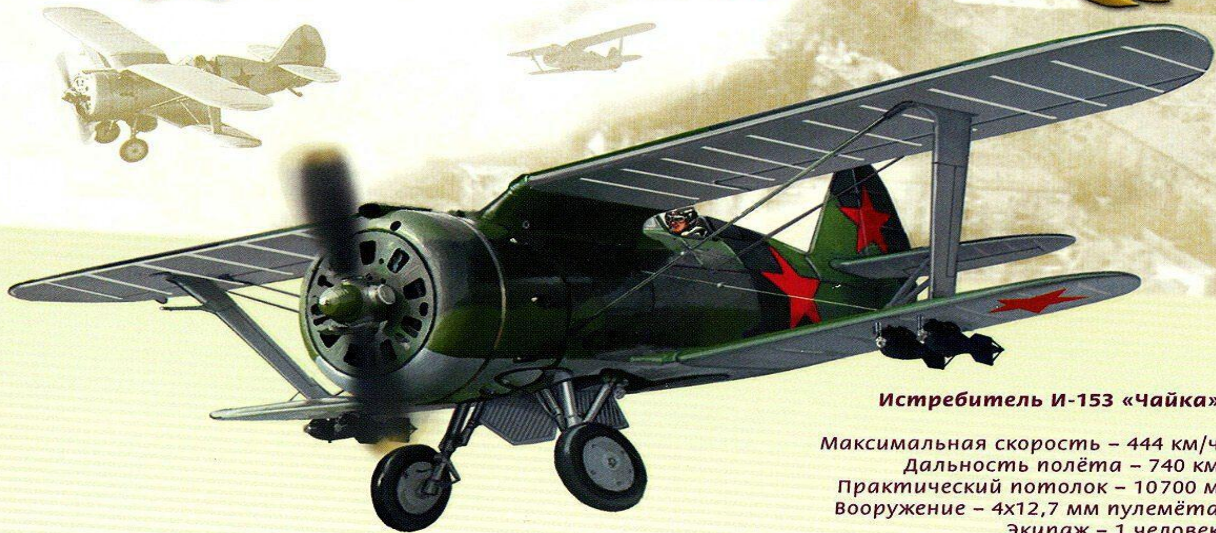
Истребитель И-153 «Чайка»