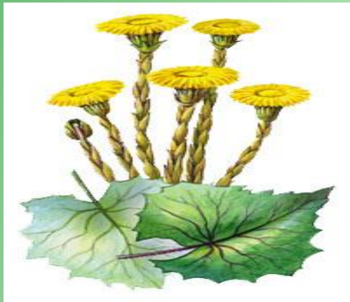
Мать и мачеха