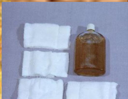
Индивидуальный противохимический пакет ИПП-8