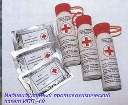
Индивидуальный противохимический пакет ИПП-10