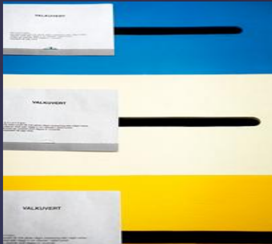
Выборы в органы трех уровней — три избирательных бюллетеня.