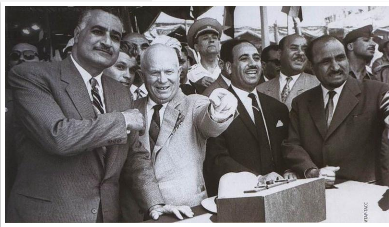
15 мая 1964 года Никита Хрущев и президент Египта Гамаль Абдель Насер