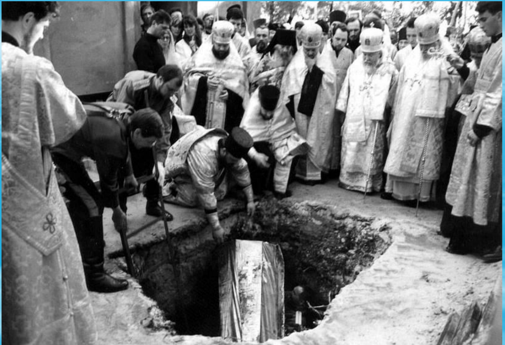
Обретение мощей святого блаженного Андрея 3 июня 1998 года.