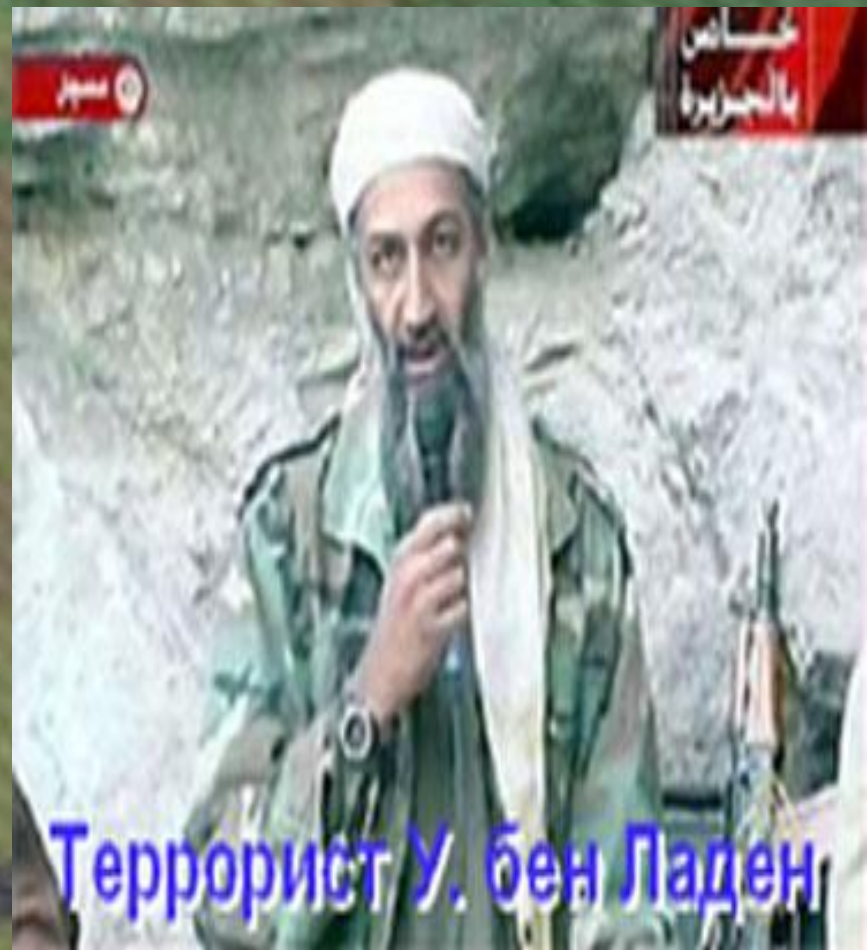
Террорист У. бен Ладен