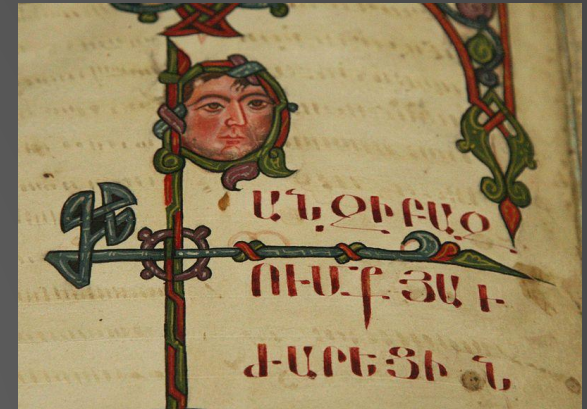
Рукопись XIII века