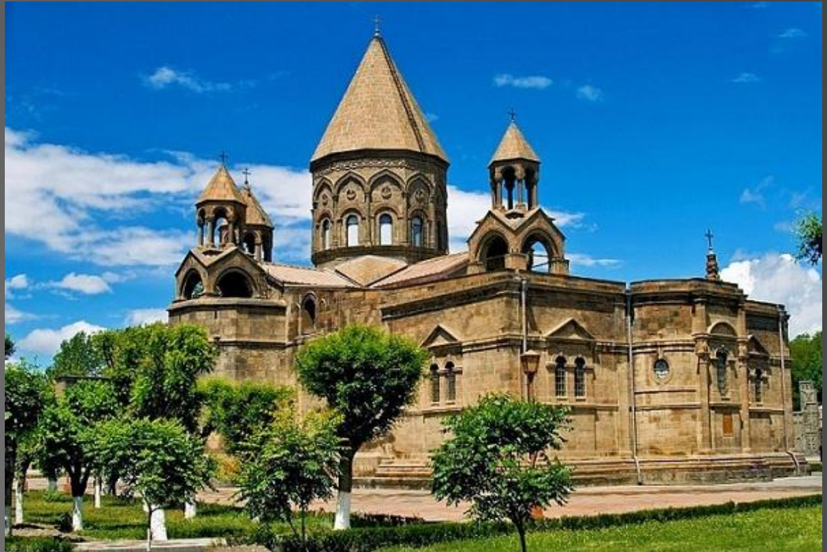
Духовный центр Армянской апостольской церкви — Святой Первопрестольный Эчмиадзин