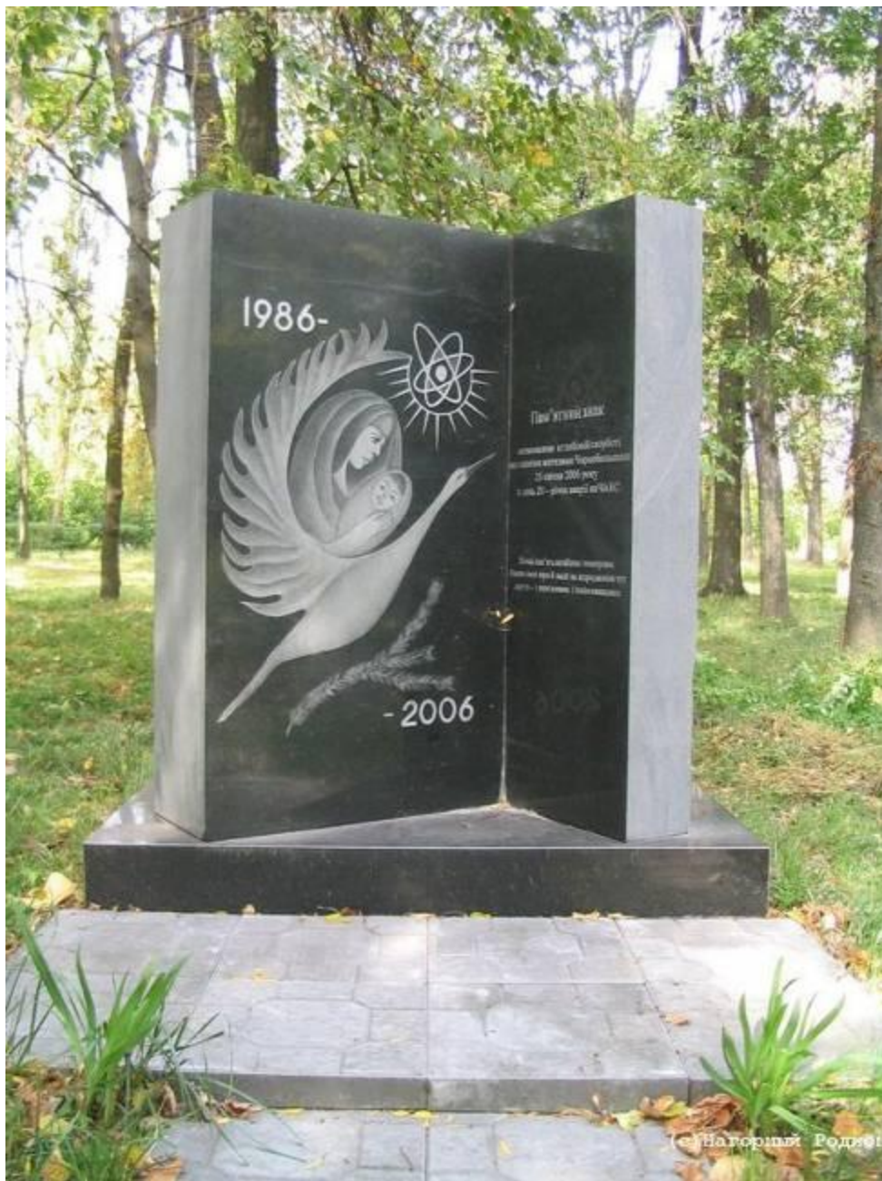
Памятный знак, установленный к двадцатилетию аварии на ЧАЭС. Парк в Чернобыле.