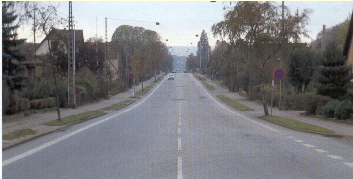
Haderslevvej before the conversion.