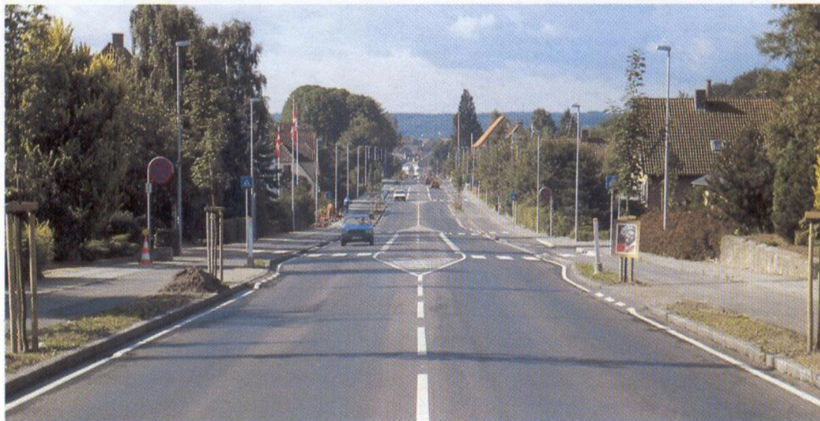
The traffic island shields off the left-turn lane and provides for safer crossing of the road.