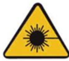
351 Опасно. Лазерное излучение