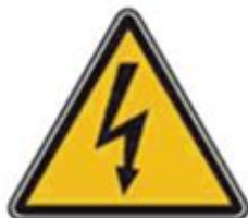
349 Опасность поражения электрическим током