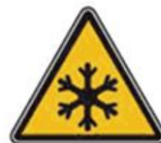
358 Осторожно. Холод