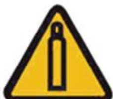
360 Газовый балон