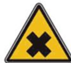
359 Осторожно. Вредные для здоровья аллергические (раздражающие) вещества