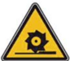
362 Осторожно. Режущие валы