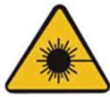
351 Опасно. Лазерное излучение