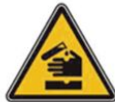
345 Опасно. Едкие и коррозионные вещества