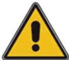
350 Внимание. Опасность (прочие опасности)