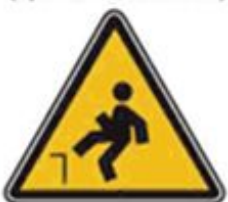
356 Осторожно. Возможность падения с высоты