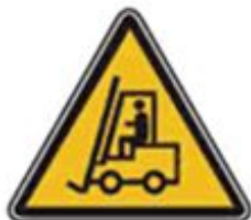
348 Внимание. Автопогрузчик