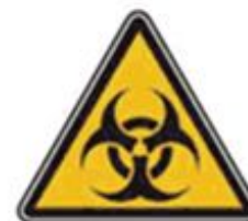
357 Осторожно. Биологическая опасность (Инфекционные вещества)