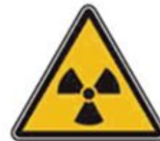
346 Опасно. Радиоактивные вещества или ионизирующее излучение