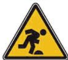
355 Осторожно. Малозаметное препятствие