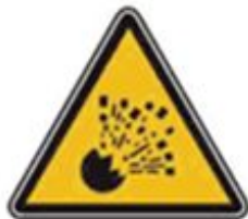
343 Опасно. Взрывоопасно