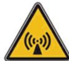
353 Внимание. Электромагнитное поле