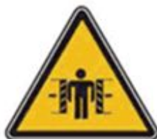
363 Внимание. Опасность зажима