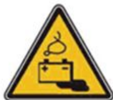
361 Осторожно. Аккумуляторные батареи