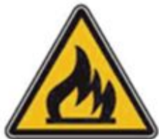
342 Опасно. Легковоспламеняющиеся вещества