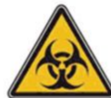
357 Осторожно. Биологическая опасность (Инфекционные вещества)