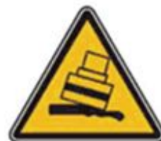
364 Осторожно. Возможность опрокидывания