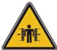
363 Внимание. Опасность зажима