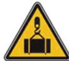
347 Опасно. Возможно падение груза