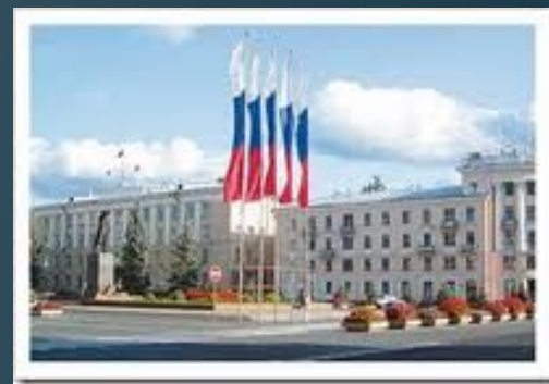
научно- исследовательские и проектные организации