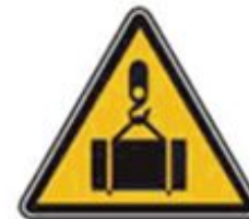
347 Опасно. Возможно падение груза