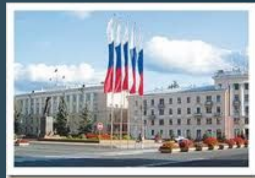
научно- исследовательские и проектные организации