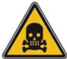
344 Опасно. Ядовитые вещества