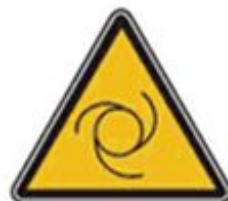
365 Внимание. Автоматическое включение (запуск) оборудования