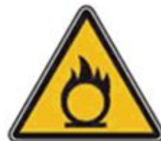
352 Опасно. Окислитель