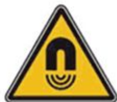
354 Внимание. Магнитное поле