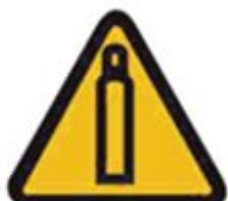
360 Опасно. Газовый баллон