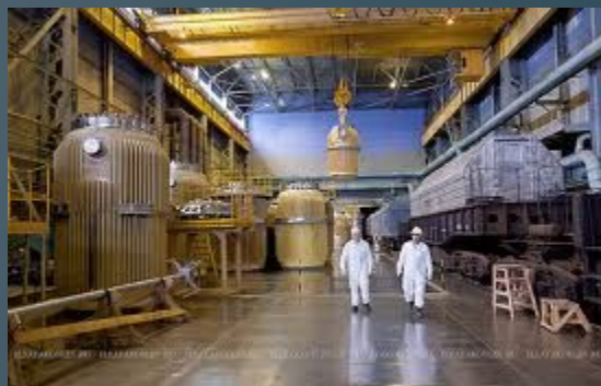
предприятия по переработке или изготовлению ядерного топлива