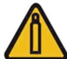
360 Опасно. Газовый баллон