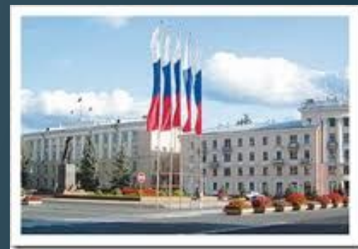
научно- исследовательские и проектные организации