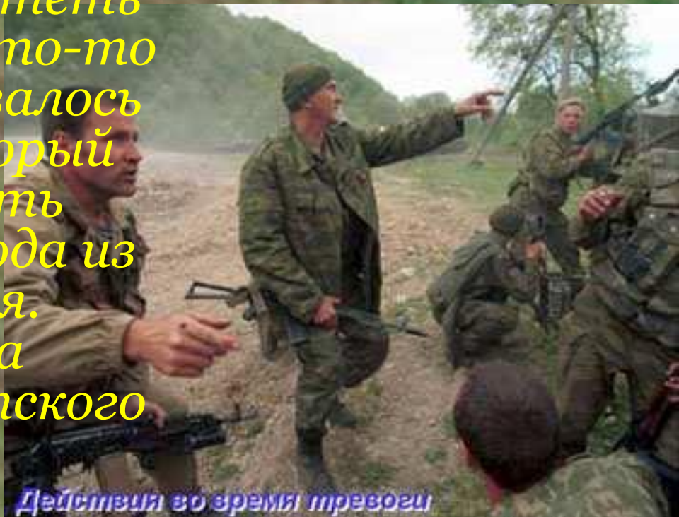
Действия во время тревоги