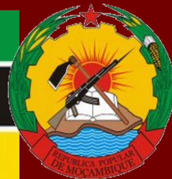
Флаг и герб Республики Мозамбик