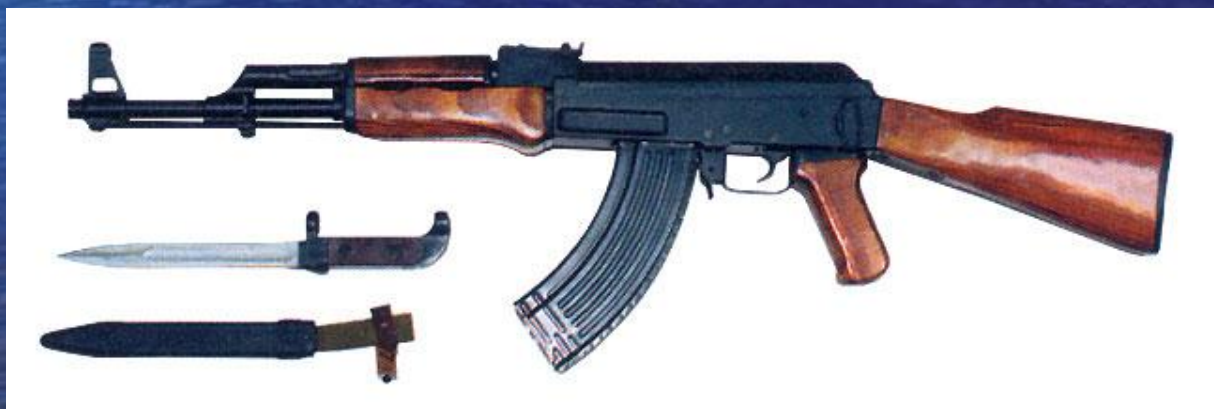
серийный автомат Калашникова АК выпуска после 1951 года, с фрезерованной ствольной коробкой