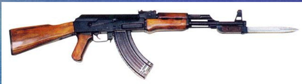
серийный автомат Калашникова АК выпуска после 1951 года, с фрезерованной ствольной коробкой