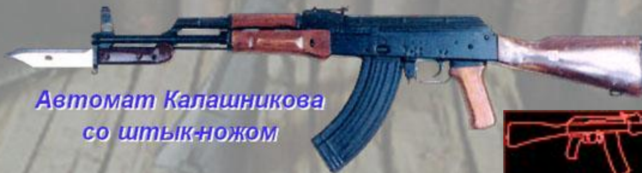
Автомат Калашникова со штык-ножом