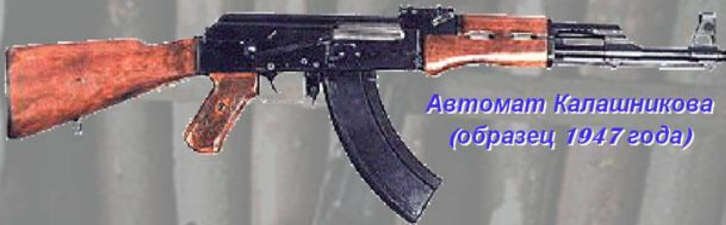
Автомат Калашникова (образец 1947 года)