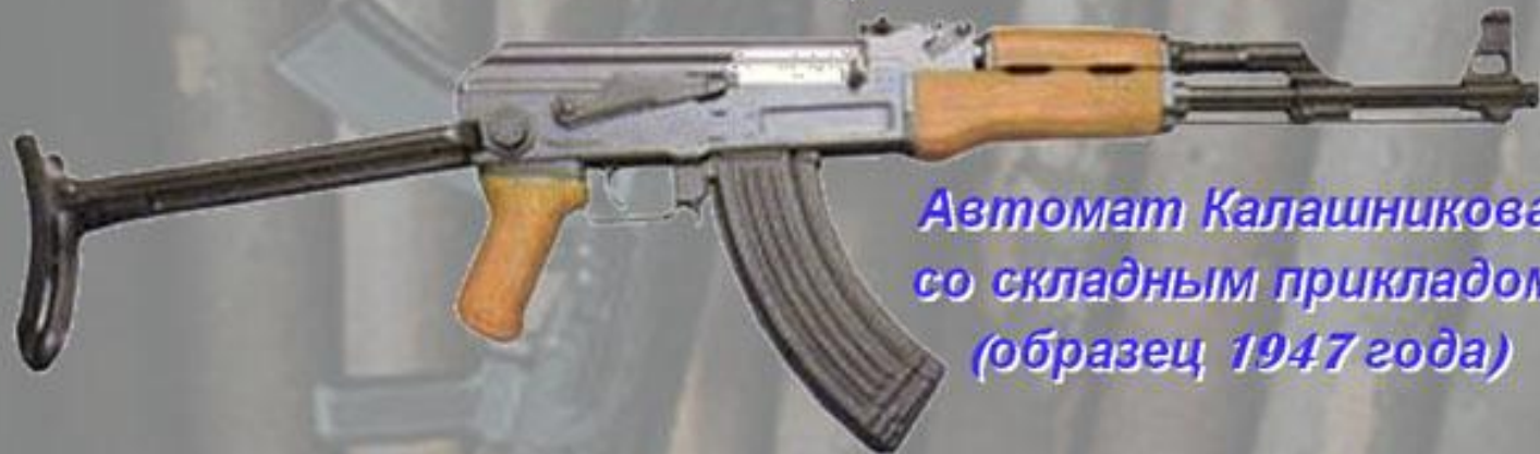
Автомат Калашникова со складным прикладом (образец 1947 года)