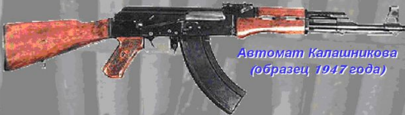
Автомат Калашникова (образец 1947 года)