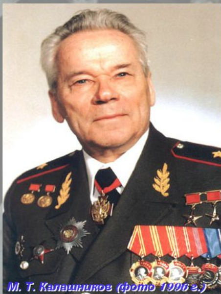
М. Т. Калашников (фото 1996 г.)