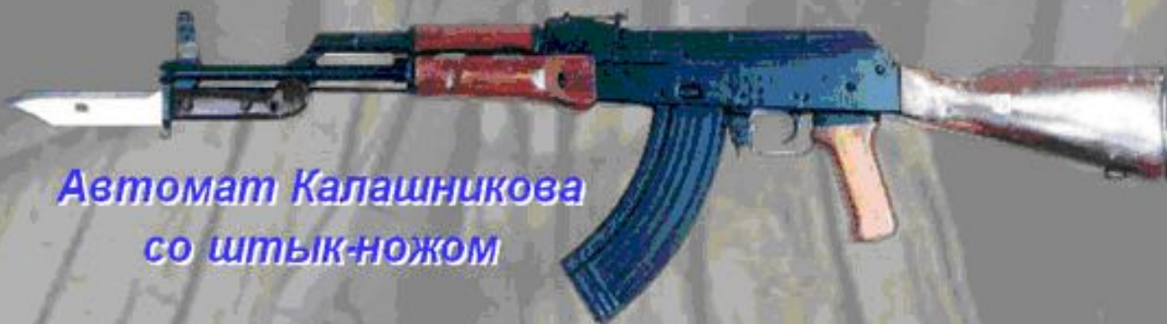
Автомат Калашникова со штык-ножом