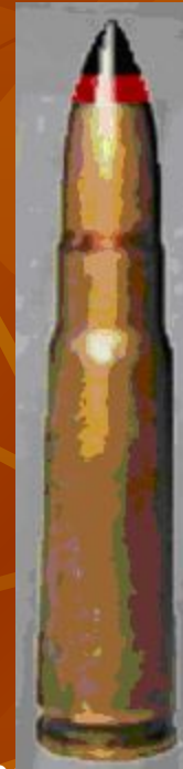
патрон бронебойно- зажигательный