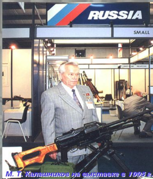
М. Т. Калашников на выставке в 1995 г.