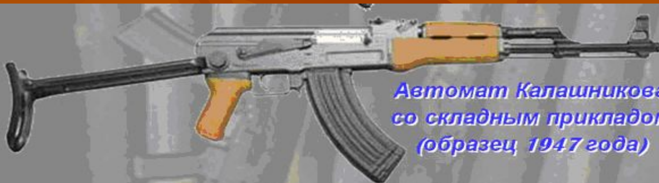
Автомат Калашникова со складным прикладом (образец 1947 года)