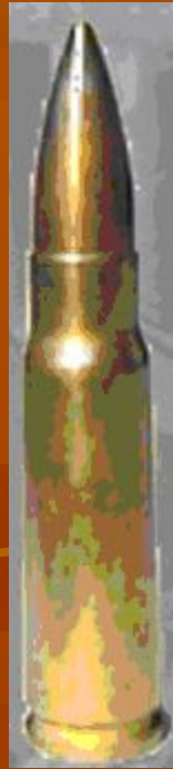
патрон обыкновенный со стальным сердечником