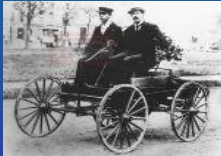
Первый автомобиль, сделанный в Детройте. 1896 год

Первые самобеглые коляски появились в 18 веке в разных странах мира. В течении длительного времени они видоизменялись и совершенствовались. Но, как всякий механизм, они требовали ухода и ремонта в случае поломки. Этим могли заниматься только люди, которые хорошо разбирались во внутреннем устройстве автомобиля. Так появилась новая профессия-автомеханик.