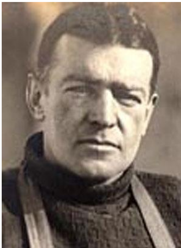
Эрнест Генри ШЕКЛТОН - английский исследователь Антарктиды. 1874 – 1922

Во время этой экспедиции (1914- 1916) годов корабль Шеклтона был раздавлен льдами, полярникам пришлось несколько месяцев дрейфовать на льдине, прежде чем им удалось пристать к безлюдному острову Мордвинова. Для спасения Шеклтон с пятью моряками отправились на вельботе к острову Южная Георгия, где обитали китобои. На шлюпке они сумели преодолеть более 1100 км по водам самого бурного района Мирового океана, окрещенного моряками «неистовыми пятидесятыми». Еще несколько месяцев потребовалось, чтобы найти подходящий пароход и снять с острова остававшихся там товарищей, а затем спасти зимовщиков со второго экспедиционного судна, высадившихся у старой базы Шеклтона в Антарктиде. После окончания Первой мировой войны Шеклтон вновь отправляется к берегам Антарктиды на шхуне «Квест». В январе 1922 года он высаживается в когда-то приютившем его поселке китобоев на Южной Георгии. Вечером делает запись в дневнике, а ночью от внезапного сердечного приступа умирает. Его похоронили на острове, рядом с континентом, изучению и покорению которого он отдал всю свою жизнь.