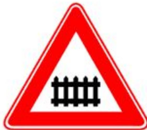
Железнодорожный переезд со шлагбаумом