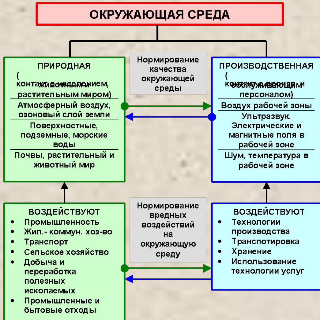
Схема нормирования вредных воздействий на окружающую среду и ее качества