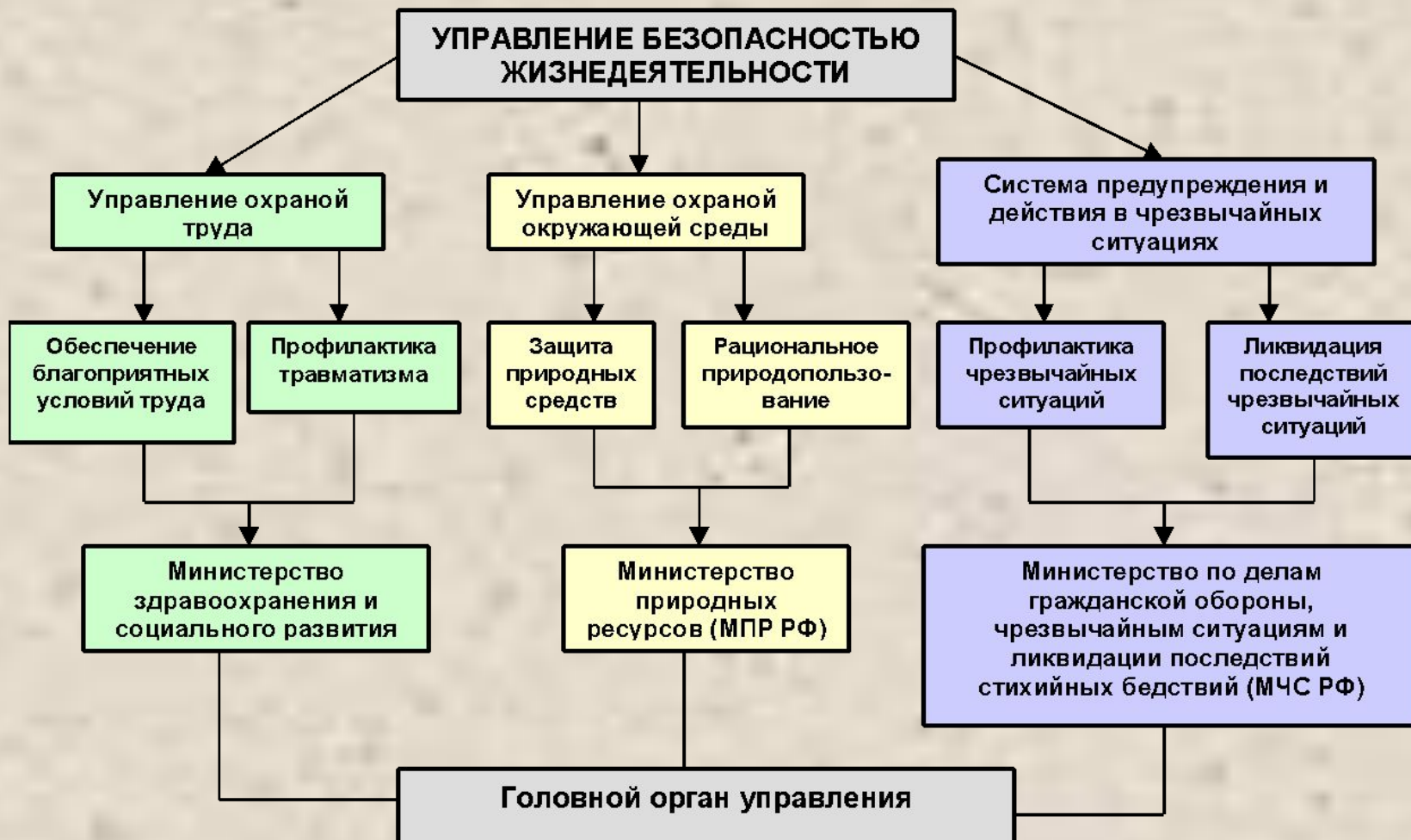
Схема управления безопасностью жизнедеятельности