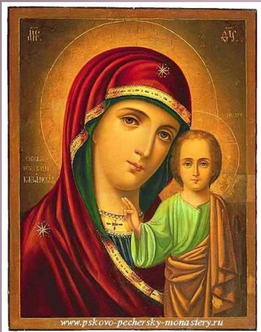
Казанская икона Богоматери мадонна»