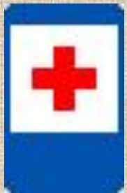
"Пункт первой медицинской помощи"