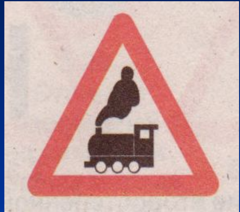
Железнодорожный переезд без шлагбаума