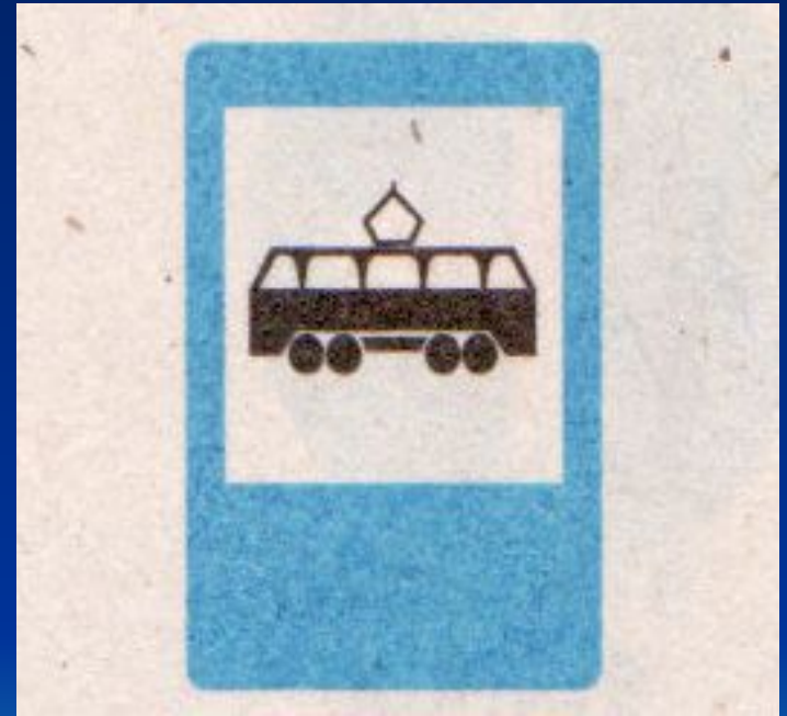
Место остановки трамвая