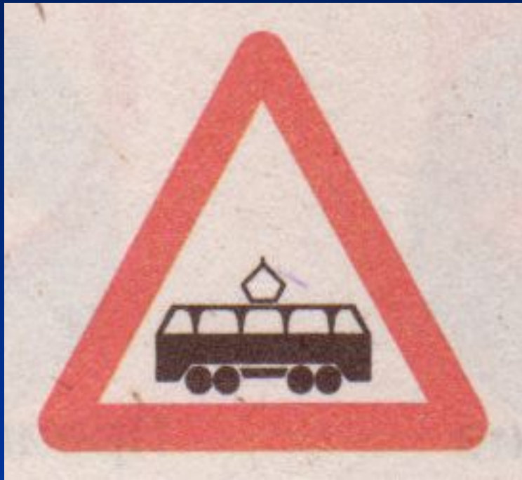
Пересечение с трамвайной линией