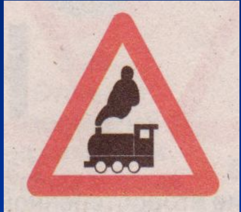
Железнодорожный переезд без шлагбаума