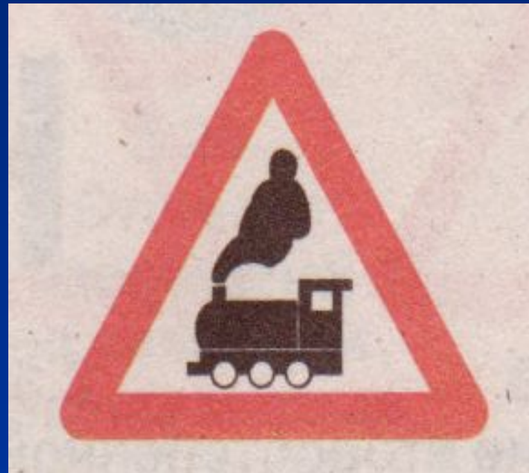
Железнодорожный переезд без шлагбаума