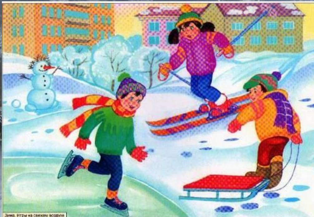
Зима. Игры на свежем воздухе