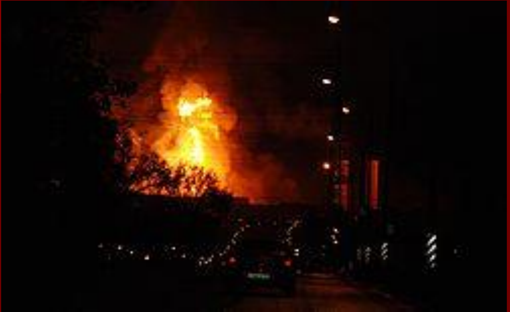
Авария на газопроводе в Москве Москва ( 2009 год )