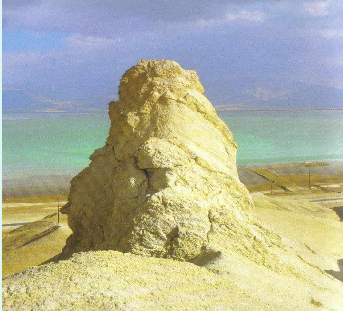
Соляной столб — жена Лота

Появление одного из таких столпов народные традиции связали с фигурой жены Лота.