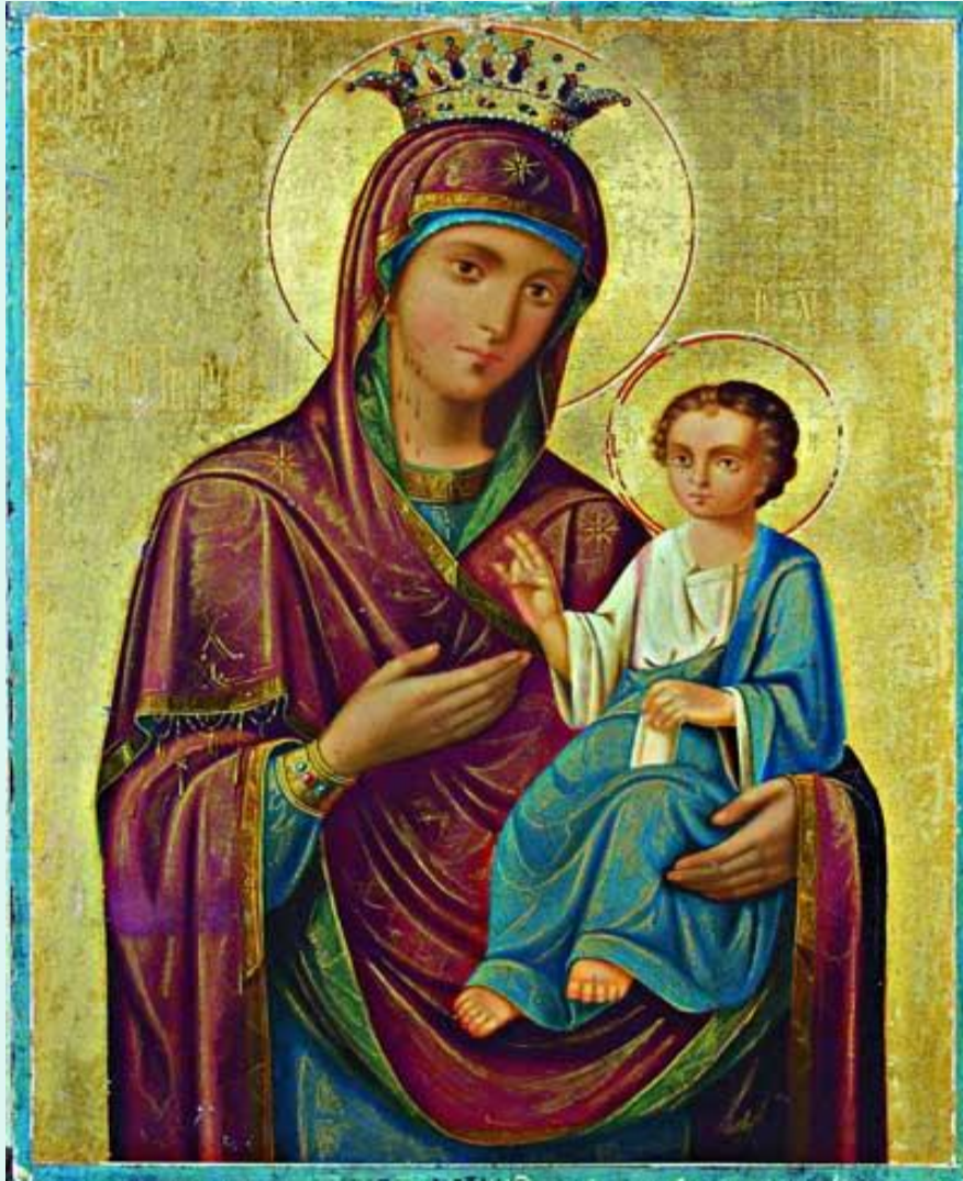
Икона Богоматерь Иверская