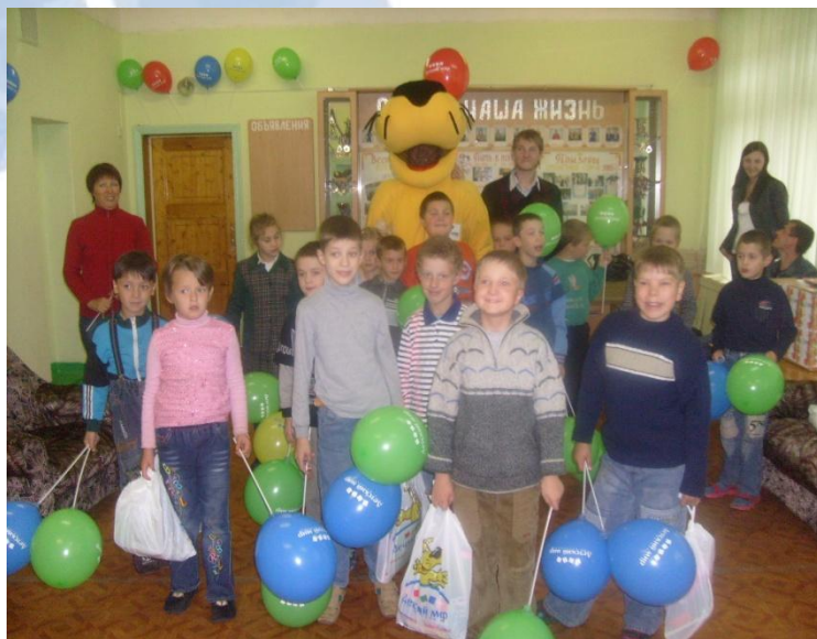
Праздник в Ярославской школе интернате № 81 .02.09.2008