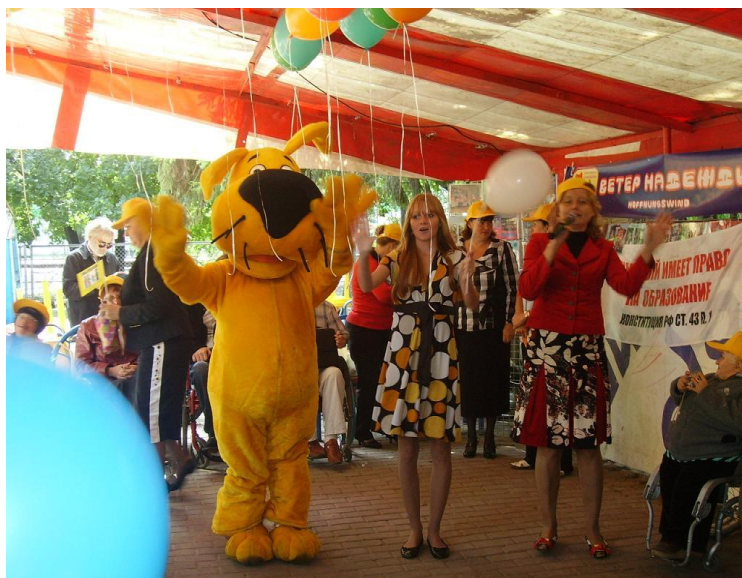
Концертное представление в Самарской город- ской общественной организации детей- инвалидов «Парус Надежды» Самара.03.09.2008