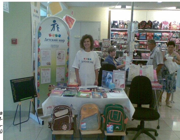
Пункт приема подарков в ДМ- Казань- Петербургский