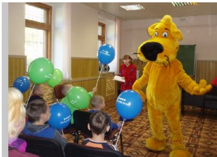
Ярославль. Праздничная программа при вручении подарков в областном реабилитационном центре Медвежонок 19.09.2007

Пункт Приема подарков. Москва, «Детский мир» на Щукинской