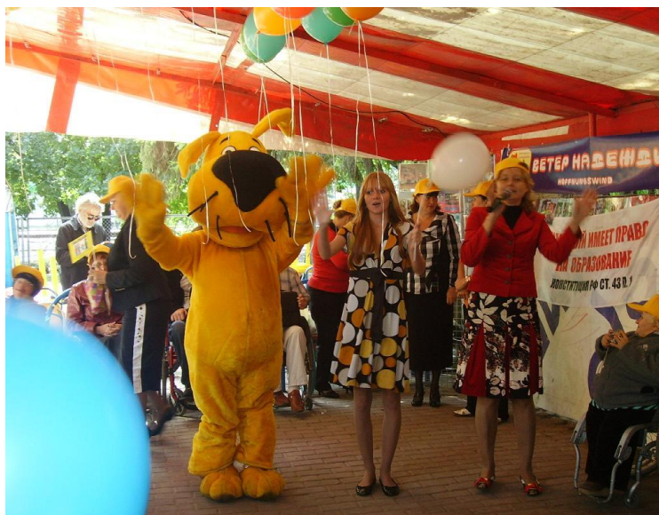
Концертное представление в Самарской город- ской общественной организации детей- инвалидов «Парус Надежды» Самара.03.09.2008