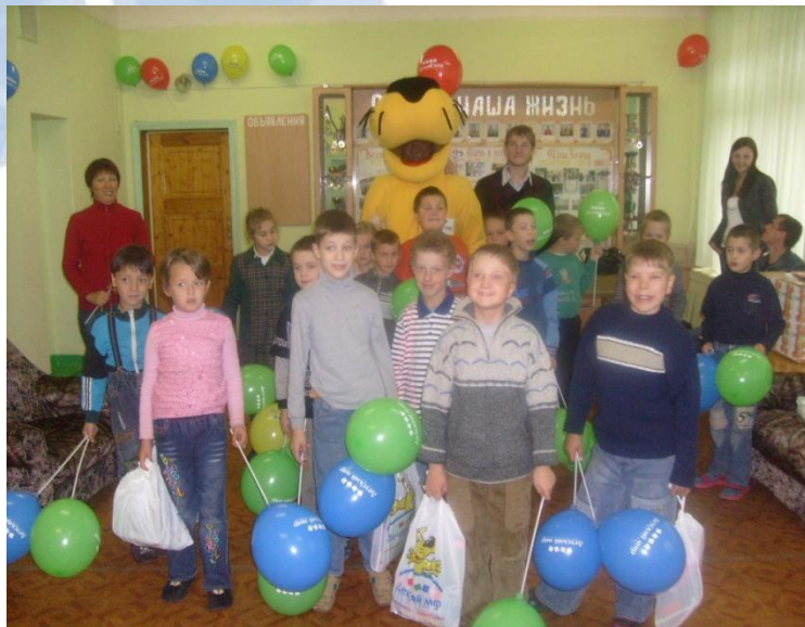
Праздник в Ярославской школе интернате № 81 .02.09.2008