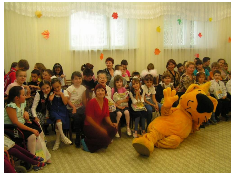
Вручение подарков в реабилитационно м центре для детей с ДЦП «Омет» (г. Наб. Челны) .09.09.2008