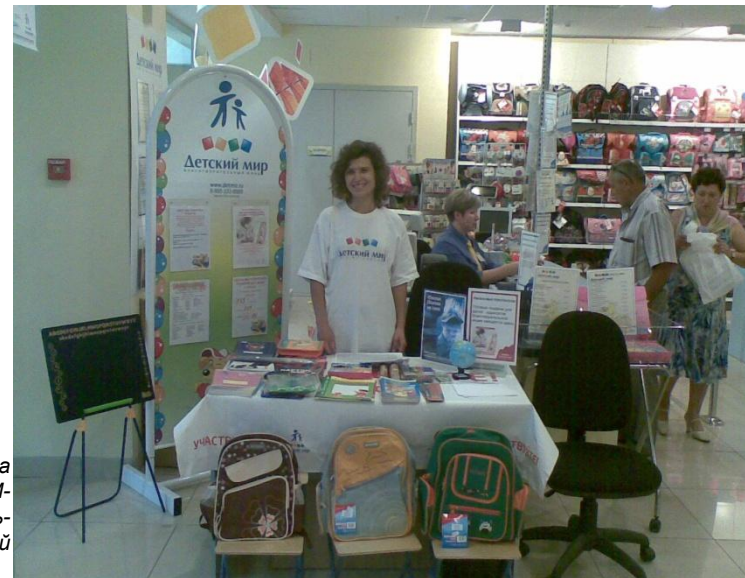
Пункт приема подарков в ДМ- Казань- Петербургский