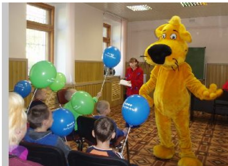
Ярославль. Праздничная программа при вручении подарков в областном реабилитационном центре Медвежонок 19.09.2007

Пункт Приема подарков. Москва, «Детский мир» на Щукинской