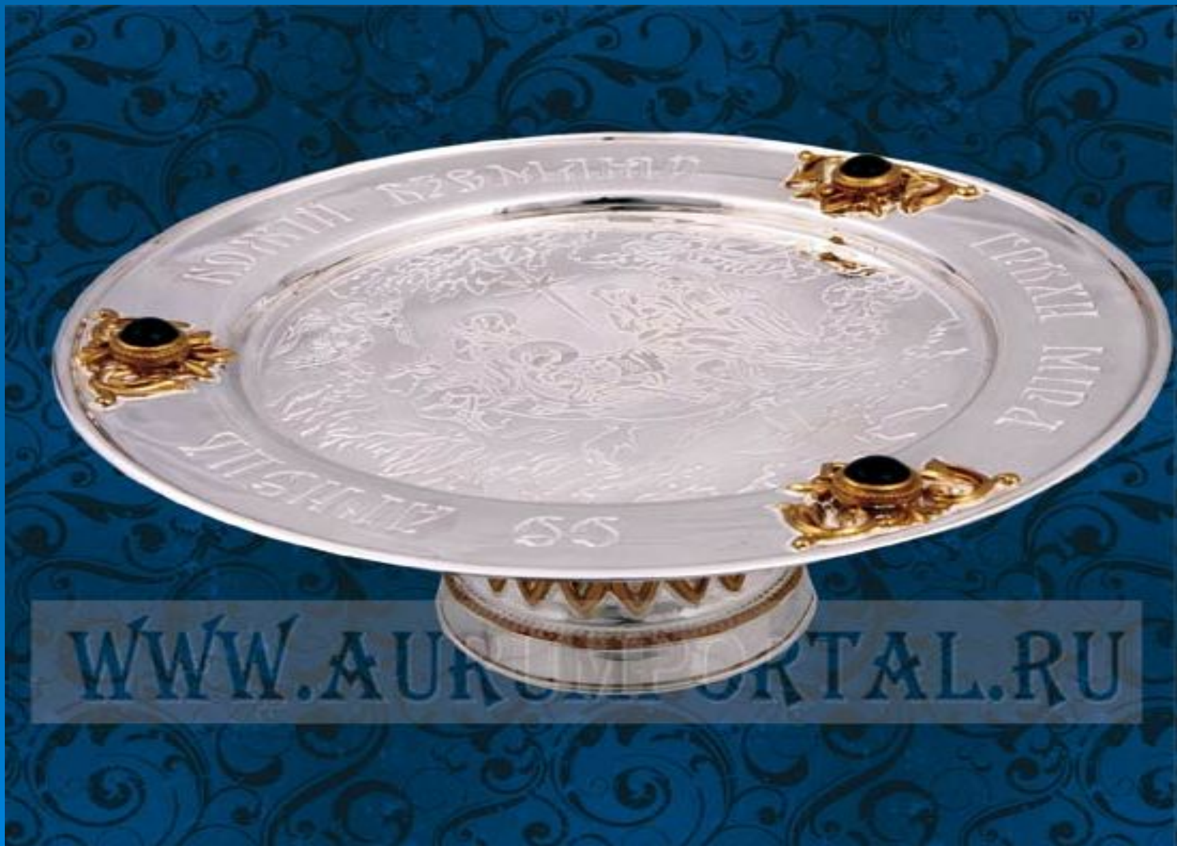
Дискос с драгоценными камнями