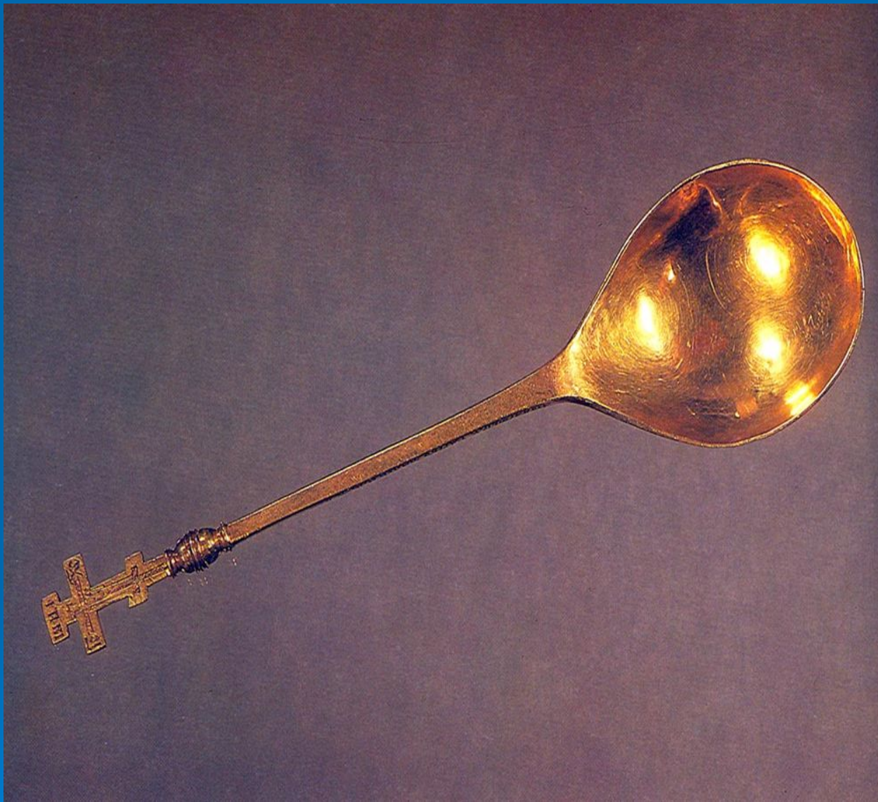
Лжица. XVII в. Россия // Русское золото XVI- начала XX века