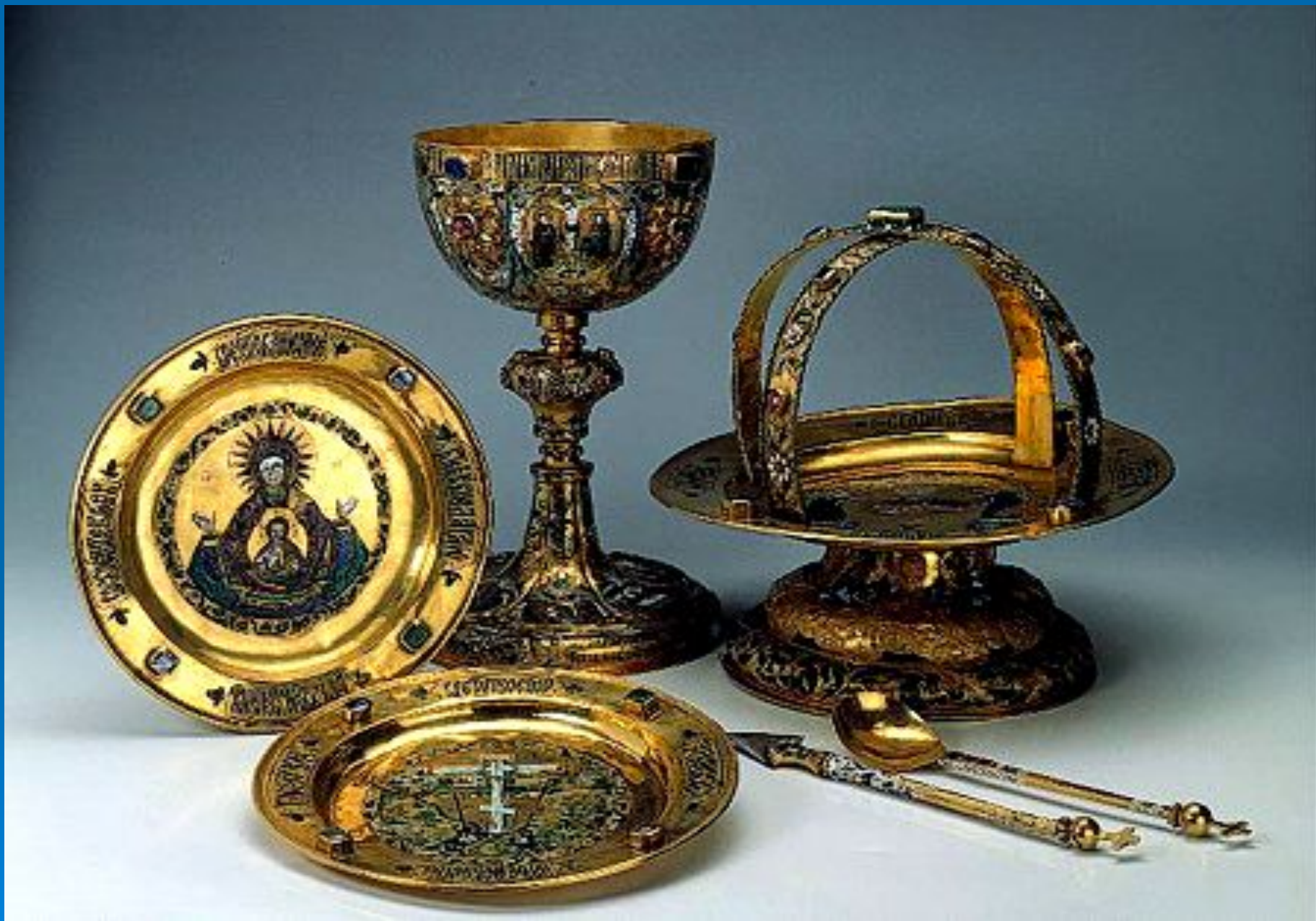
Литургический прибор: потир, дискос, звезда, тарели, лжица, копие. 1677г