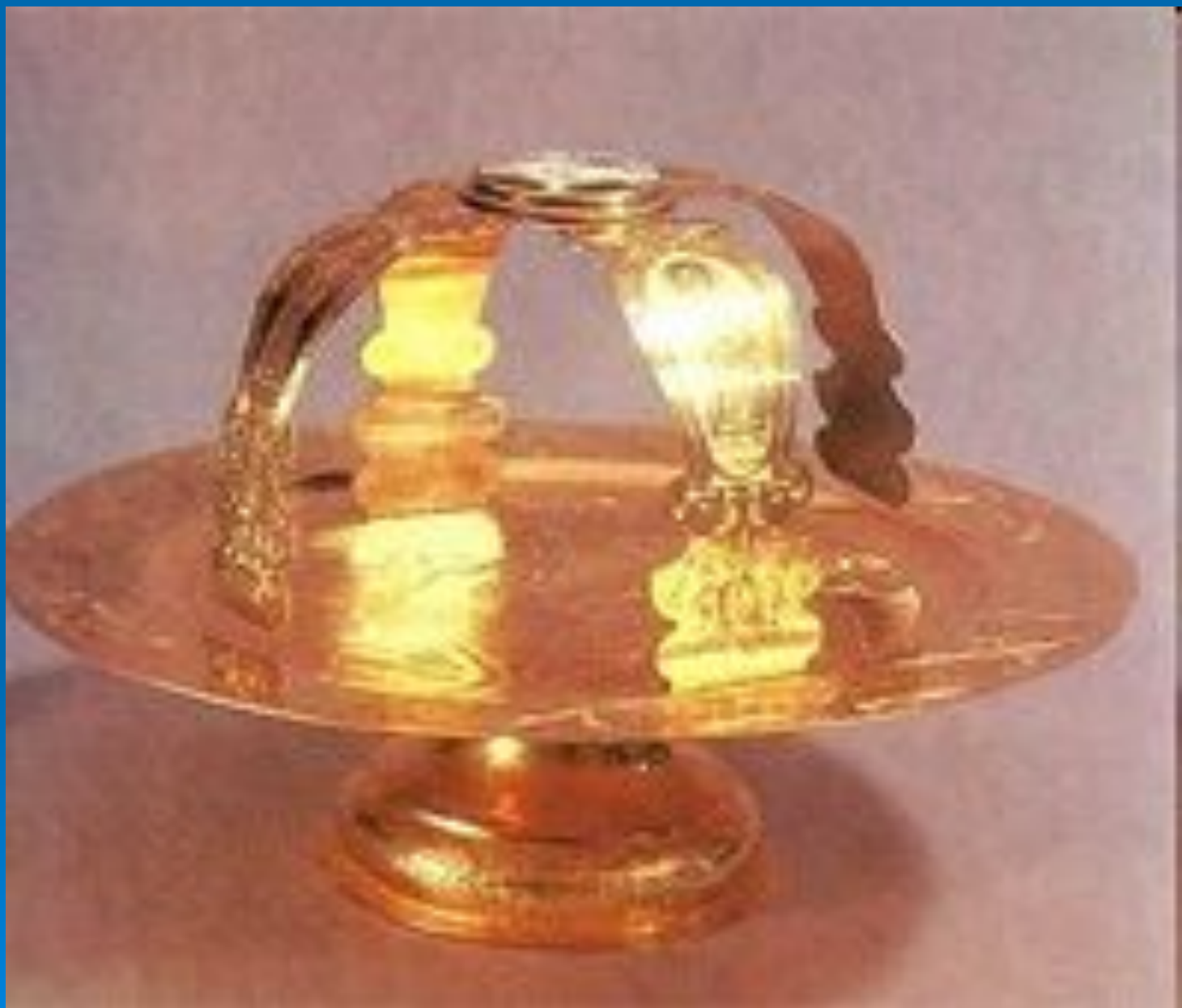
Дискос со Звездницей