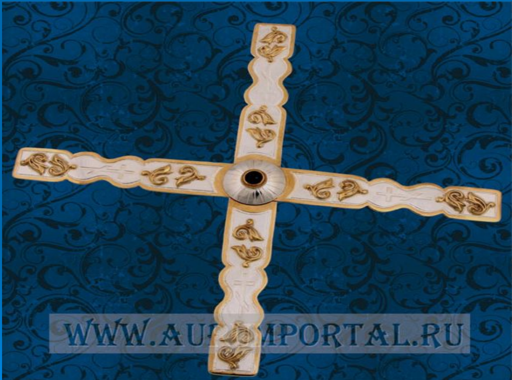
Звездница с драгоценными камнями