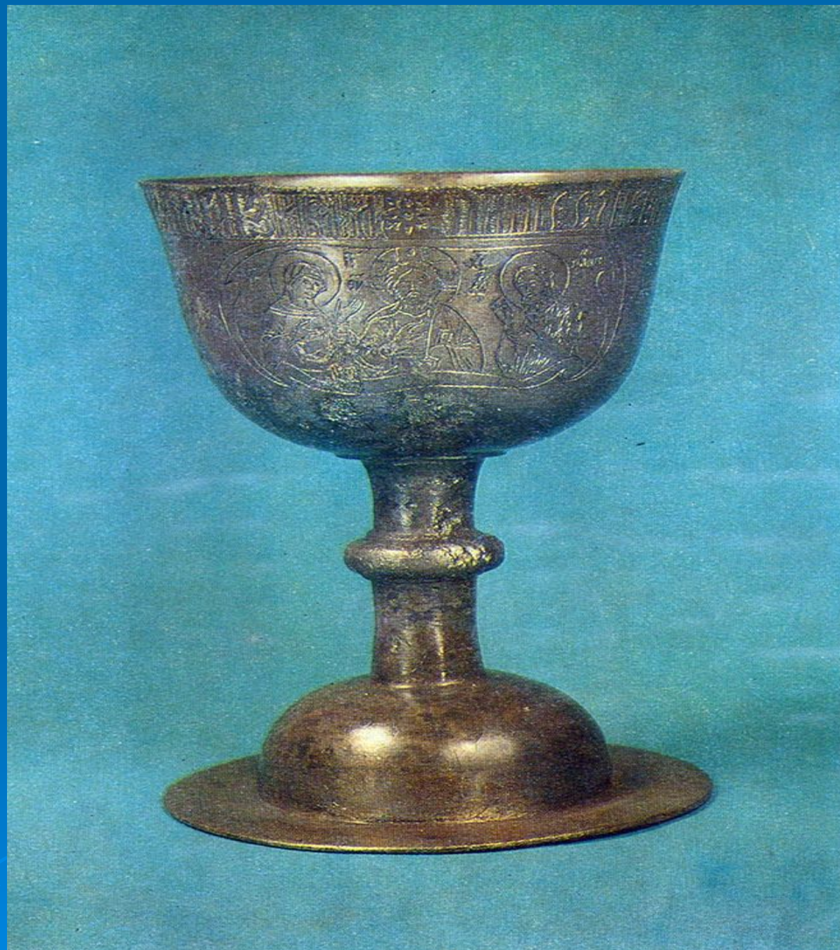
Потир. 1671 // Косцова А. Художественное олово в России XVII века из собрания Эрмитажа: Научный каталог. - Ленинград, 1982