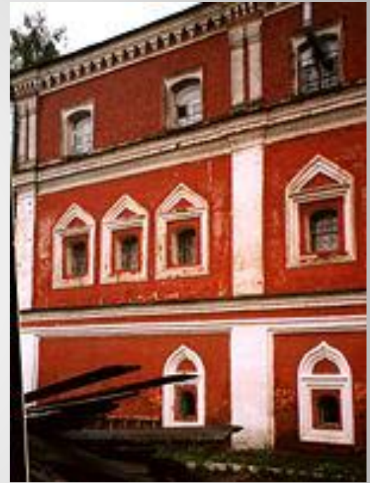
Трапезная палата в монастыре (XVII век)

Кострома – один из древнейших российских городов – в XII веке был форпостом княжеской Руси в борьбе с татаро-монгольским нашествием. В 1264 году костромское воинство под предводительством князя Василия Ярославовича одержало победу на Святом озере. Эта битва знаменательна не только ратным подвигом, но и явлением чуда великой святыни нашей земли – Фёдоровской иконы Божьей матери, которая сейчас находится в Богоявленско-Анастасиином женском монастыре.