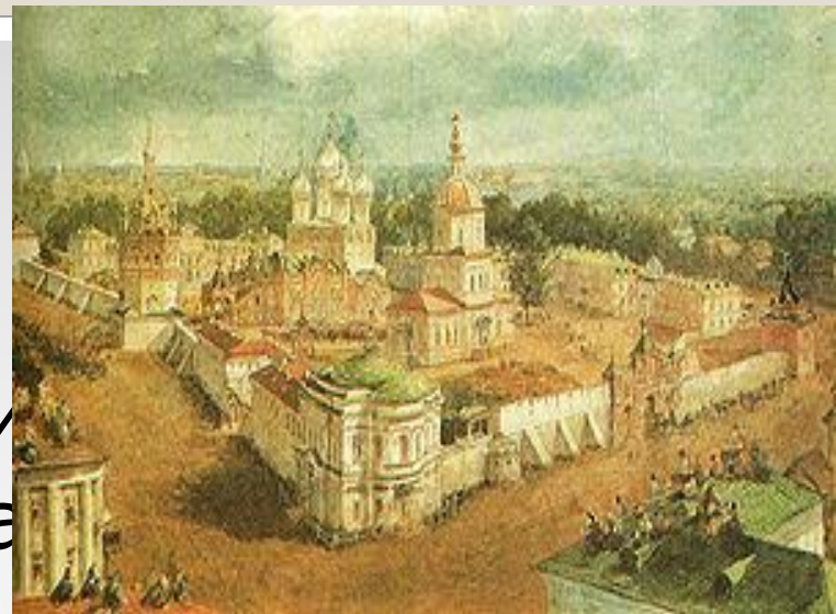
В. Садовников. Вид Богоявленского Анастасьина монастыря в городе Костроме. После 1865 года

Над широкой вольной Волгой Золотые купола, Ты всегда хранимой богом У костромичей слыла.