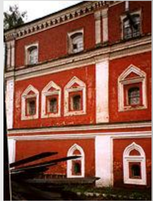
Трапезная палата в монастыре (XVII век)

Кострома – один из древнейших российских городов – в XII веке был форпостом княжеской Руси в борьбе с татаро-монгольским нашествием. В 1264 году костромское воинство под предводительством князя Василия Ярославовича одержало победу на Святом озере. Эта битва знаменательна не только ратным подвигом, но и явлением чуда великой святыни нашей земли – Фёдоровской иконы Божьей матери, которая сейчас находится в Богоявленско-Анастасиином женском монастыре.