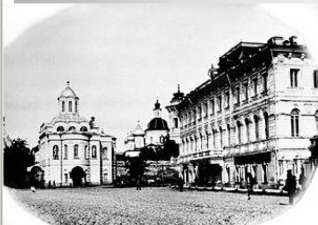
Монастырь в начале XX века

Росписью Богоявленского собора занялись в 1667 г. мастера Гурий Никитин и Сила Савин. В подклете Богоявленского собора сохраняются надгробные камни.