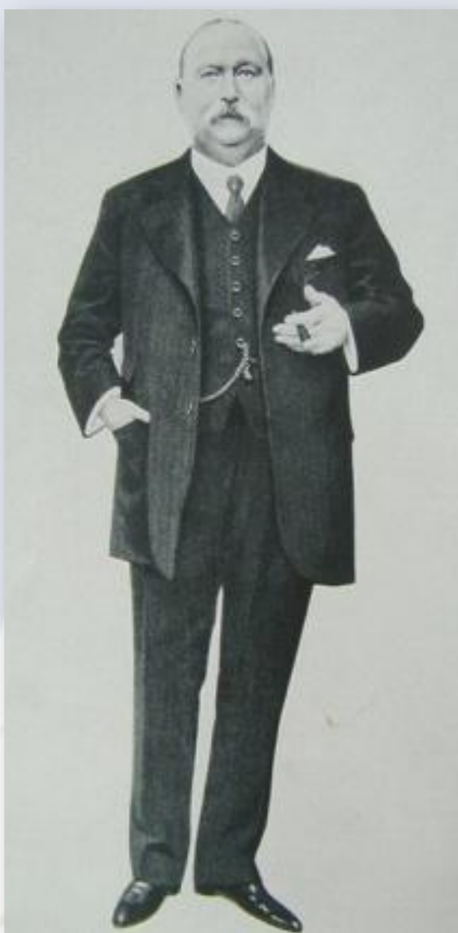
Вильям Нокс Д' Арси

Это открытие положило основание «Англо-персидской нефтяной компании» , основанной Вильямом Ноксом Д'Арси в 1909 году.