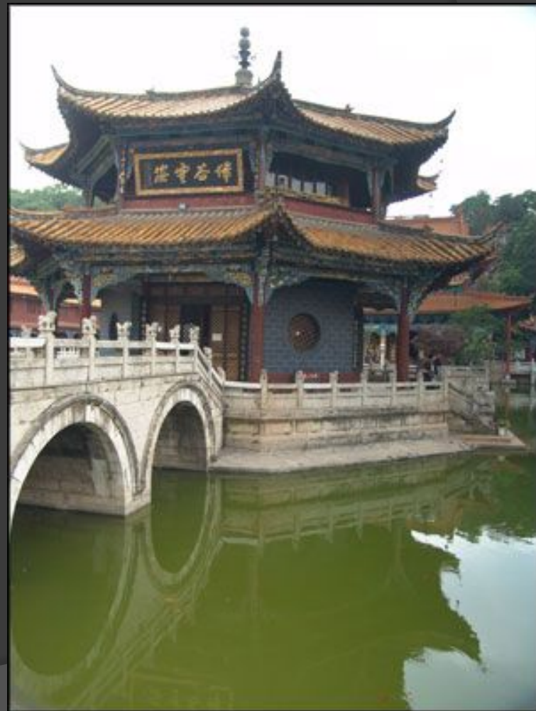
Буддийский монастырь в Куньмине