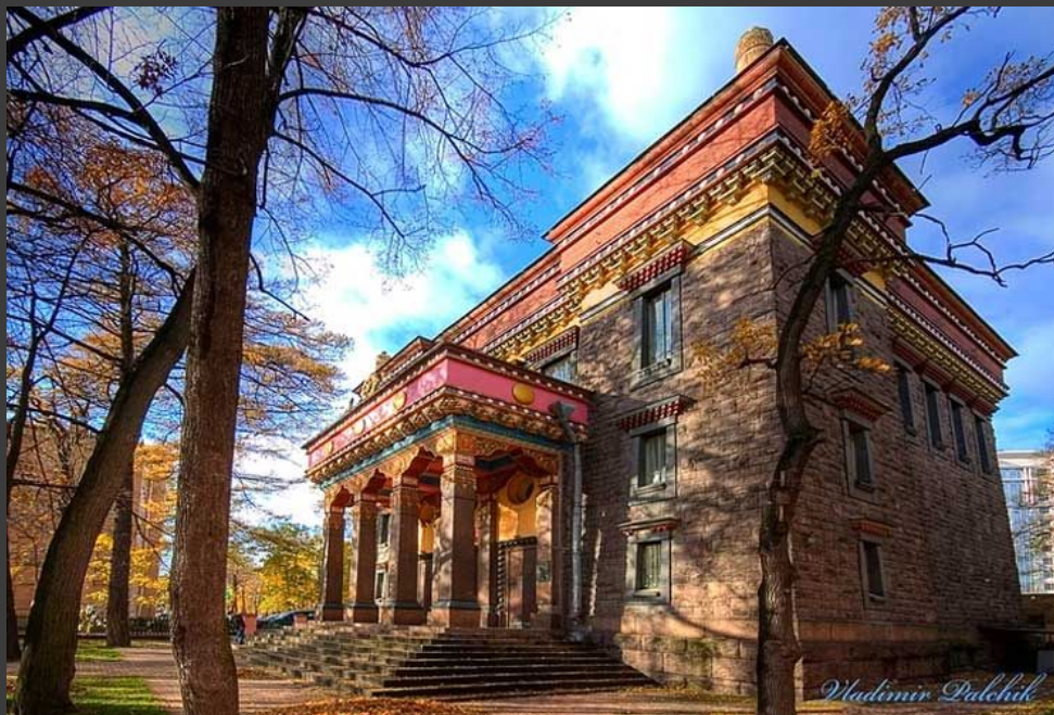
храм-молельня в С.Петербурге.