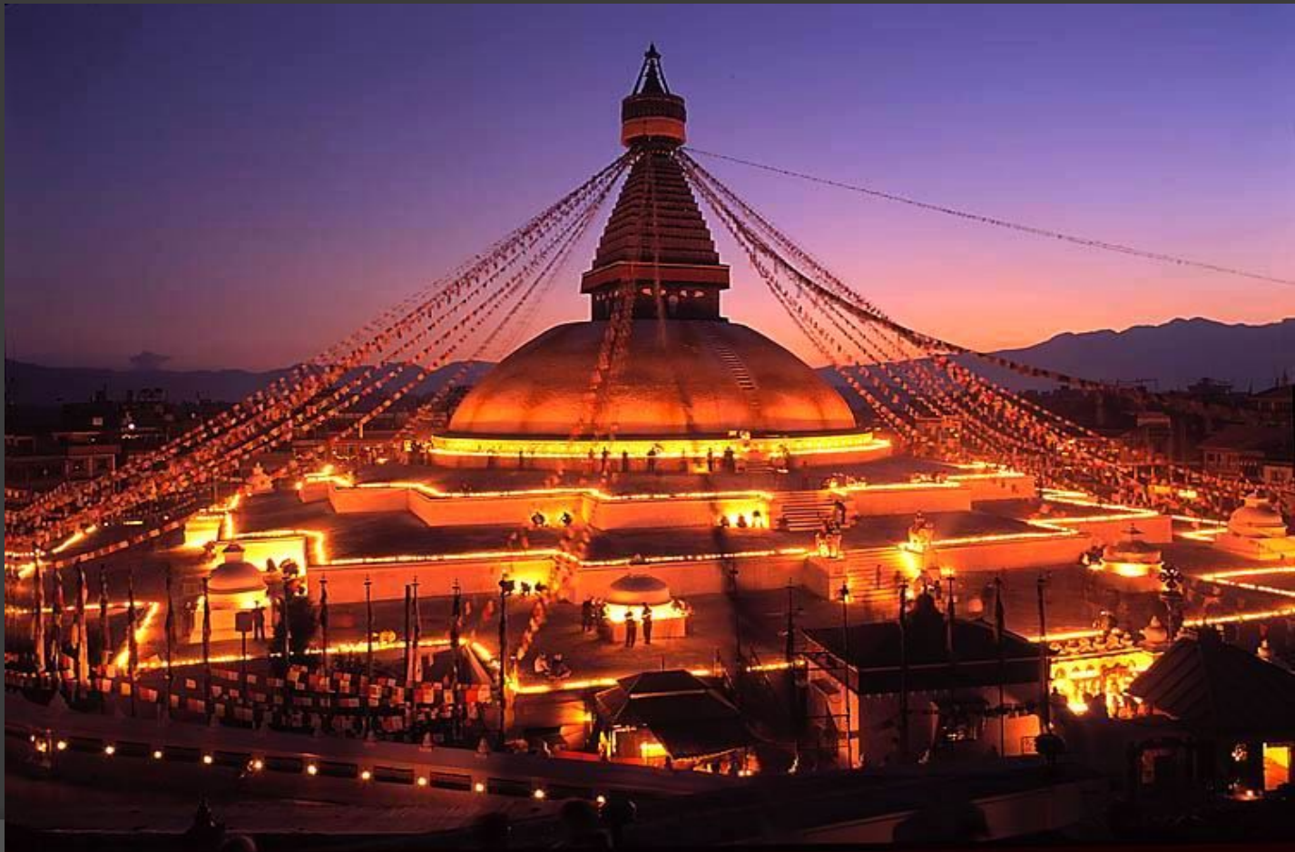
Знаменитая ступа Будднатх