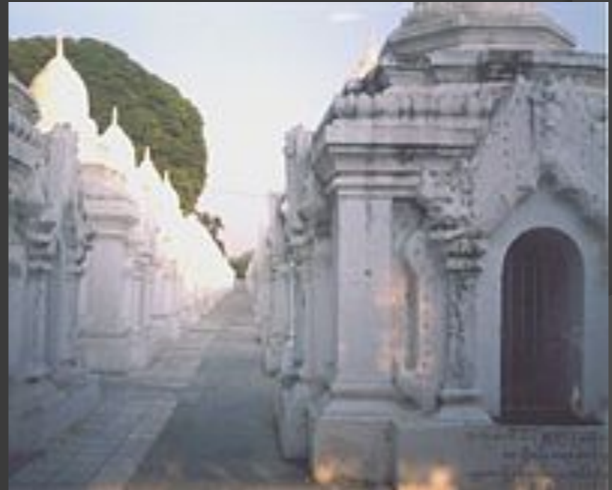
Высеченная на мраморе Типитака в Куто-до Пайя