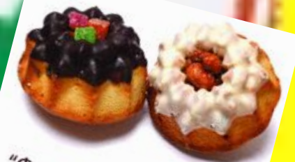
«Фонарик» с орехами или с цукатами