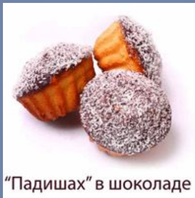
“Падишах” в шоколаде