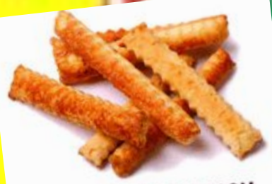
«Хворост» с сахаром или сырнй