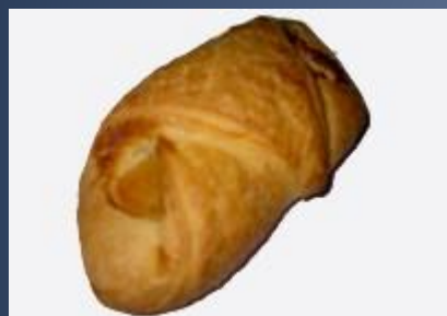
Слойка с курагой