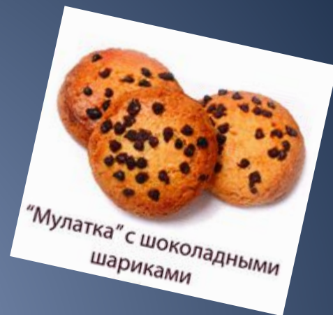
“Мулатка” с шоколадными шариками