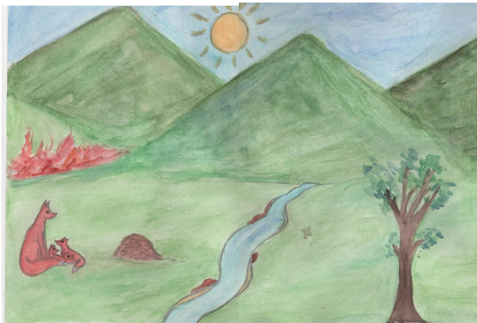
Рис. Цыренжаповой С., 8 класс. Беда надвигается.

На сегодняшний день доля естественных пожаров (от молний) составляет около 7 %-8 %, то есть возникновение большой части лесных пожаров связано с деятельностью человека