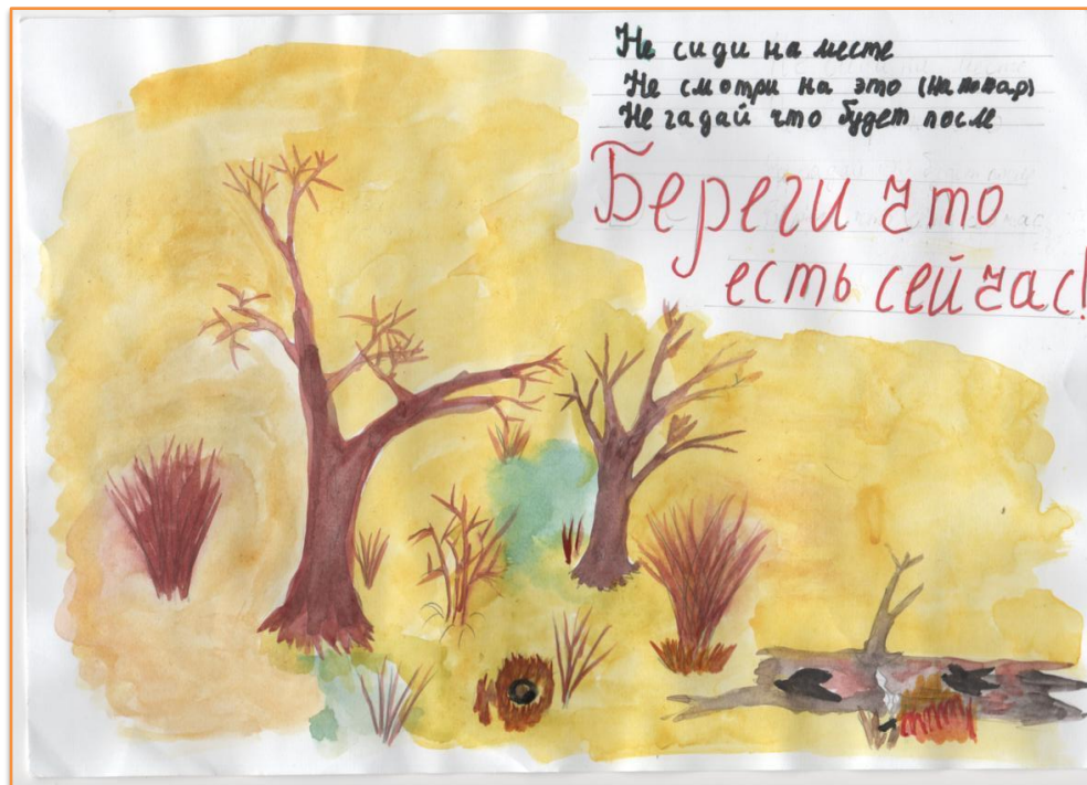
Рис. Жалсановой Д., 8 класс.