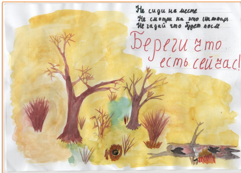
Рис. Жалсановой Д., 8 класс.