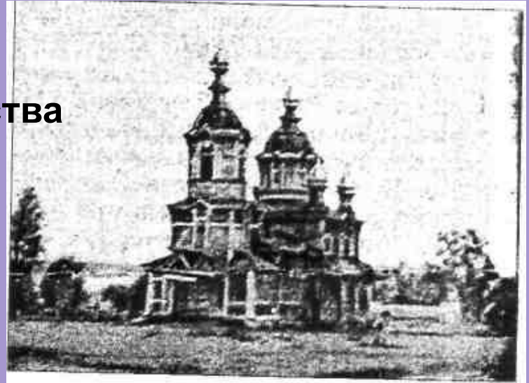
Церковь Божией Матери Казанской. с. Большая Выла.