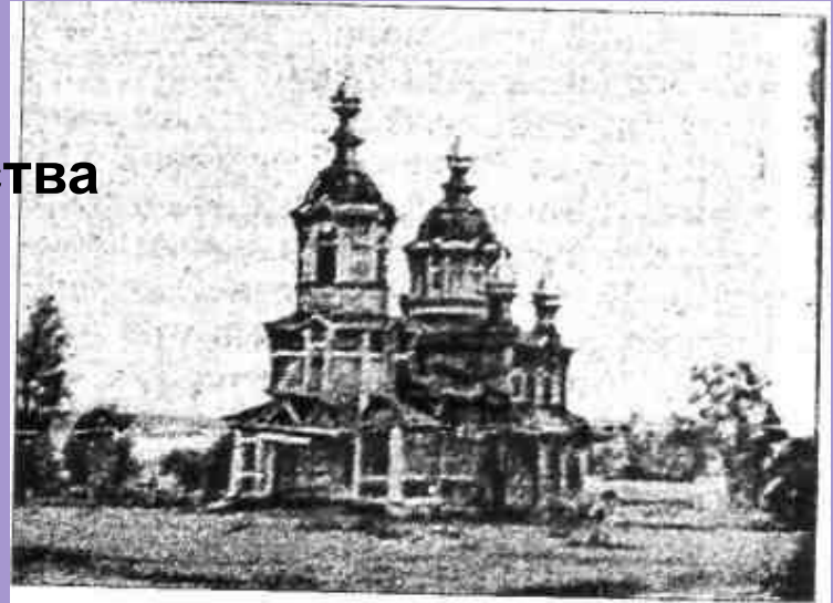
Церковь Божией Матери Казанской. с. Большая Выла.

Церковь Божией Матери Казанской построена в с. Большая Выла на средства прихожан в середине 1740 –х гг., вторая – в 1784, последняя 1906, однопрестольная. Церковь была деревянная, теплая, длинная с колокольней 13 саж., наибольшая ширина 6 саж. Закрыта в 1940 году . Икона Божией Матери Казанской способствовала возвышению православия среди народов Сред. Поволжья после взятия Казани в 1552.(В 1579 девятилетней дочери стрельца Онучина явилась в сонном видении Богоматерь и повелела достать Её (икону), закрытую в землю тайными последствиями православия еще во время господства ислама. Так была обретена икона, которая стала святыней.) Церковные праздники: 21 июля - летний Казанский. 4 ноября - зимний Казанский.