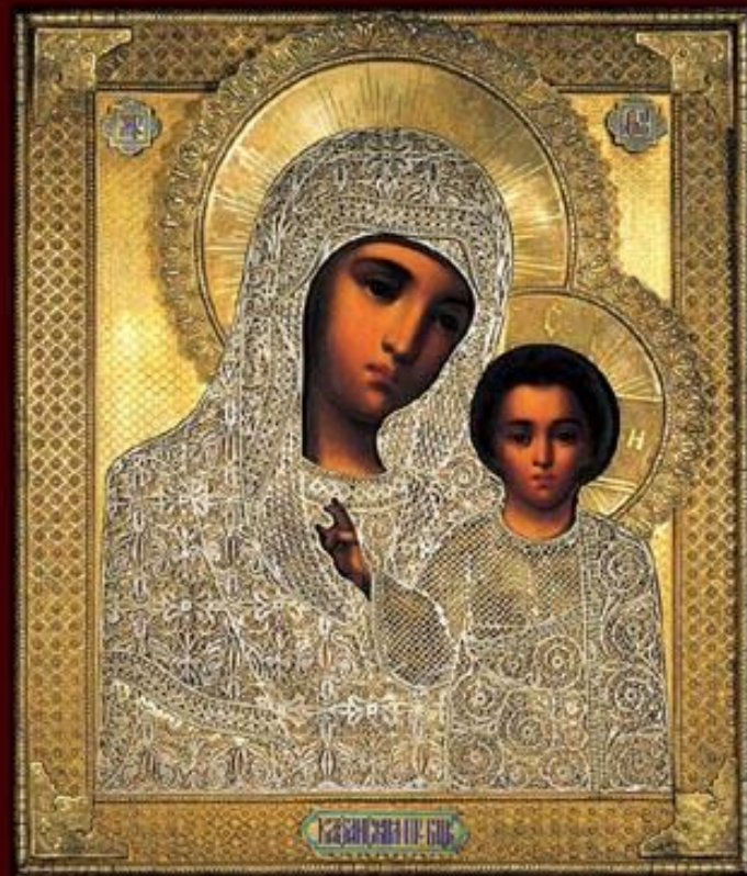
Казанская икона Богородицы в окладе (XIX век)

На месте явления иконы был построен Богородицкий девичий монастырь , первой монахиней игуменьей которого стала Матрона, принявшая имя Мавра