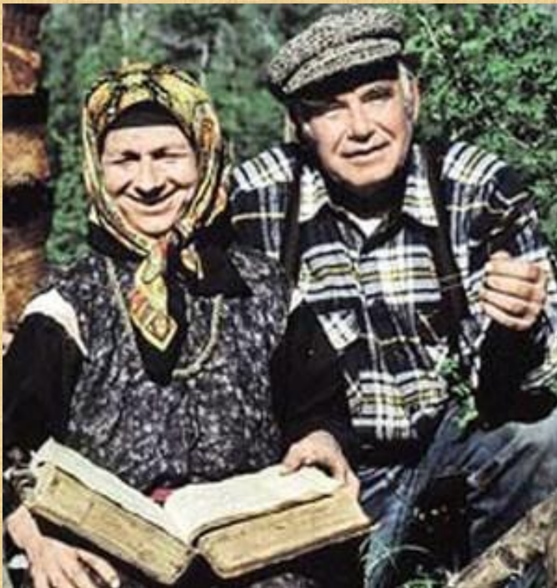
В.М.Песков и Агафья Лыкова