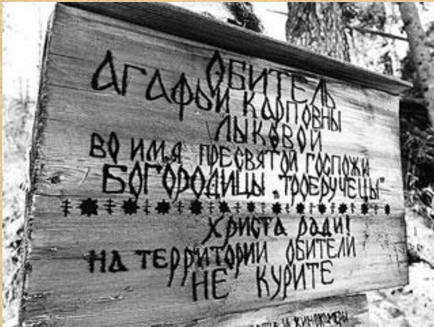
Агафья Лыкова-хозяйка обители на Еринате