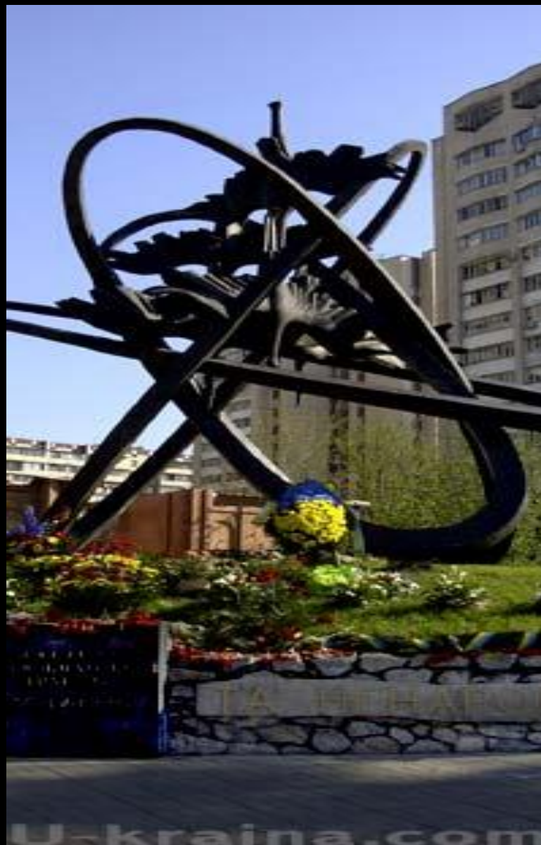
Монумент на ул. Чернобыльской (Киев)