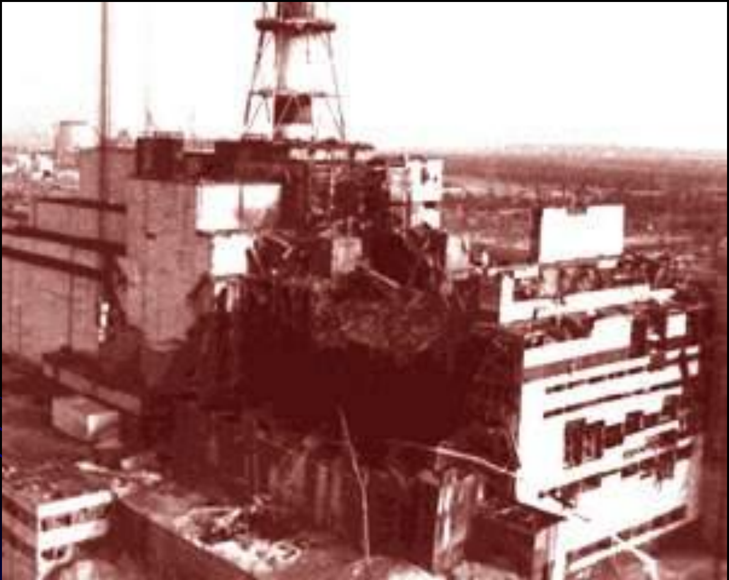
Разрушенный 4ый реактор АЭС