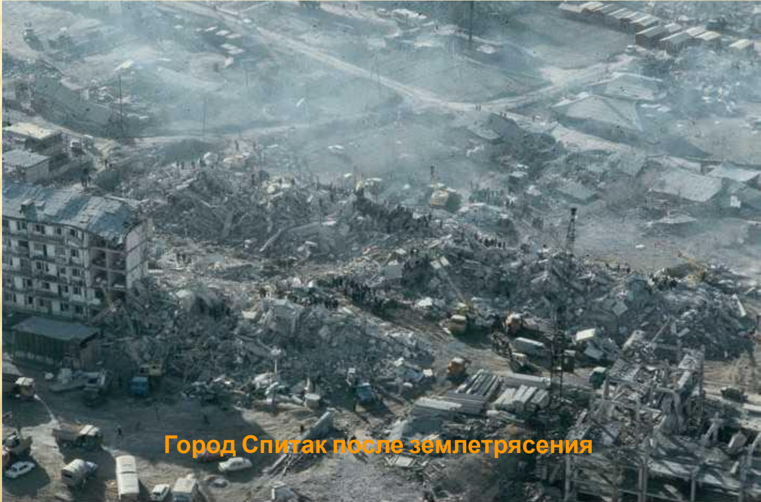
Город Спитак после землетрясения

Чрезвычайную ситуацию можно предвидеть, но чаще всего она возникает внезапно