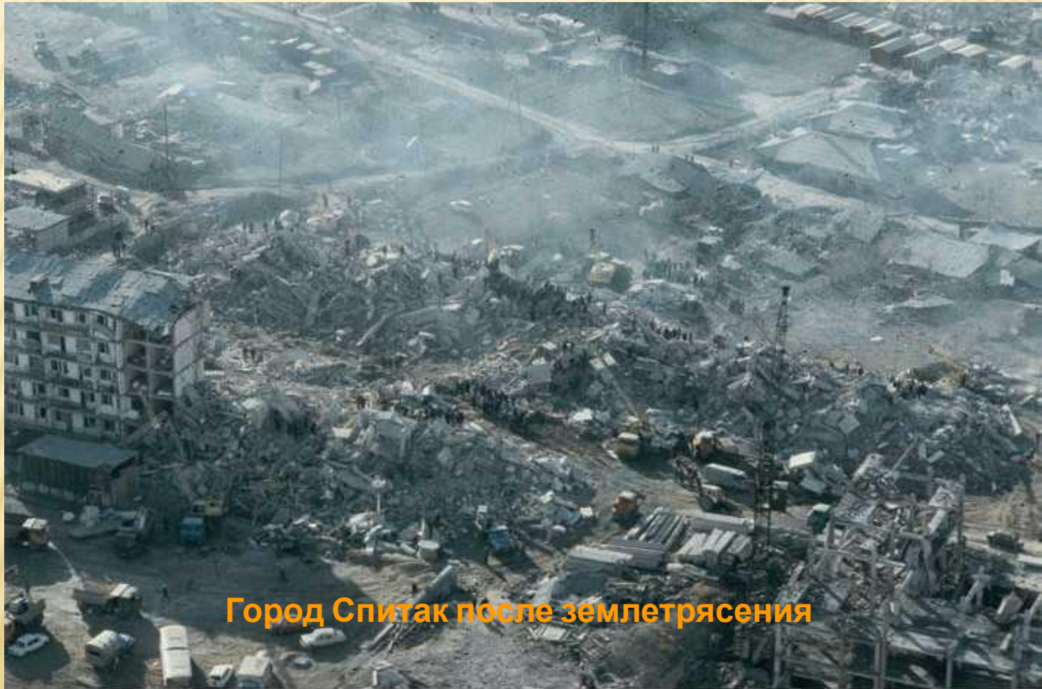
Город Спитак после землетрясения

Чрезвычайную ситуацию можно предвидеть, но чаще всего она возникает внезапно