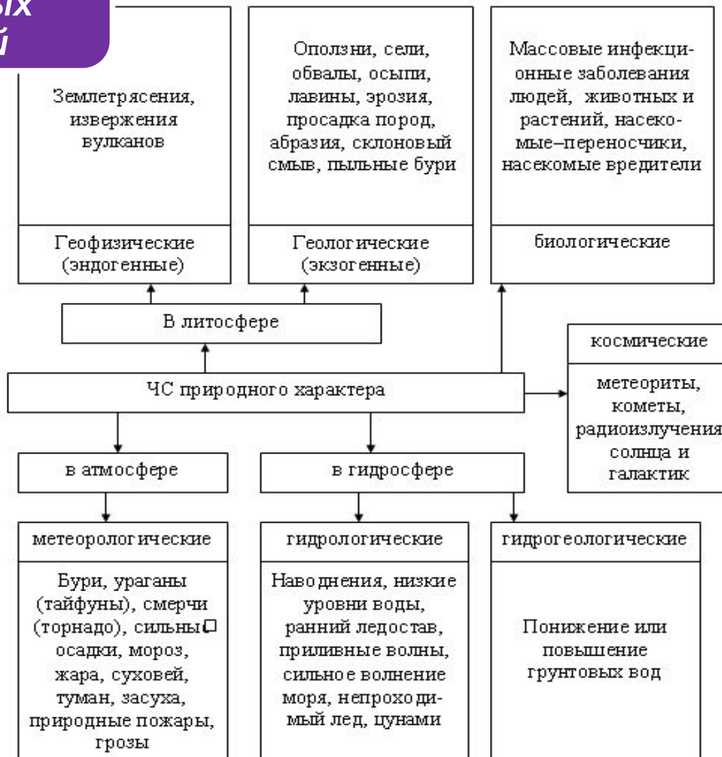
Рис. Классификация ЧС природного характера