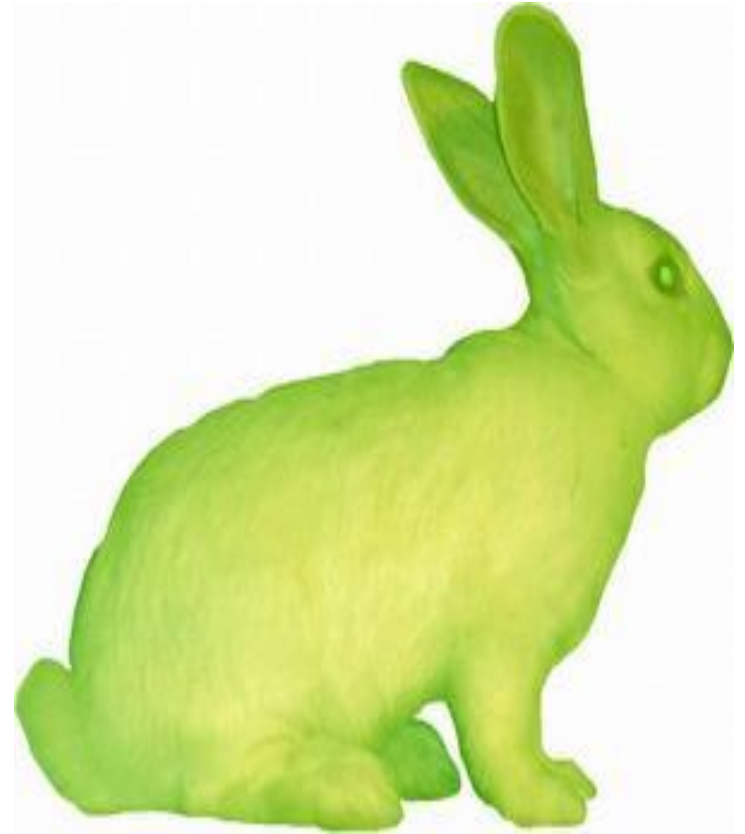
Флуоресцентный кролик, полученный методом генной инженерии