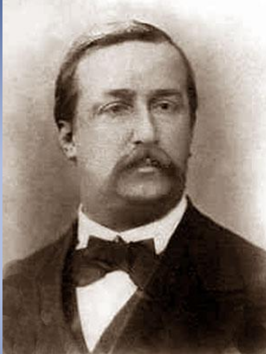
Александр Порфирьевич Бородин (1833-1887)