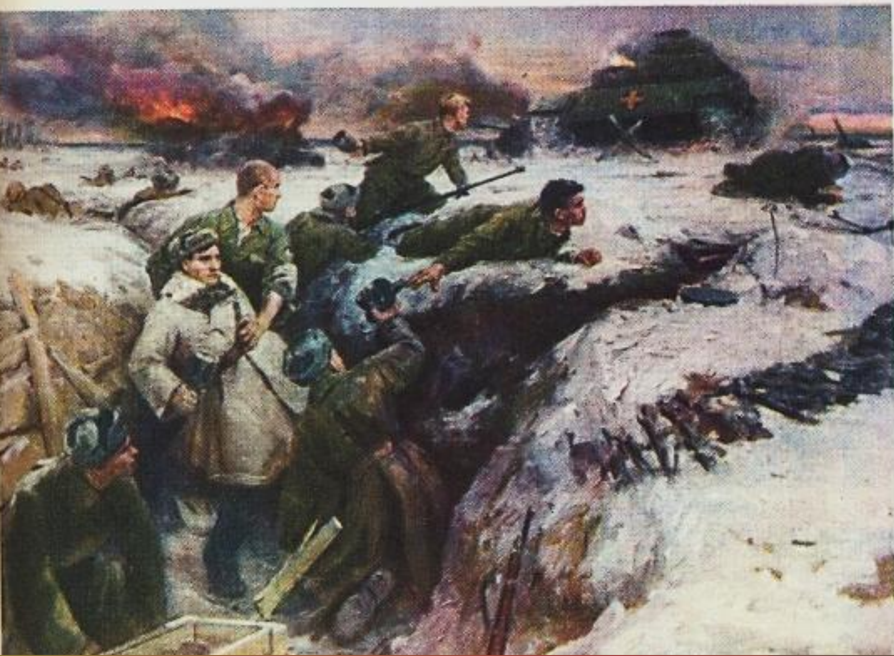
Подвиг гвардейцев-панфиловцев. С картины В. Панфилова.