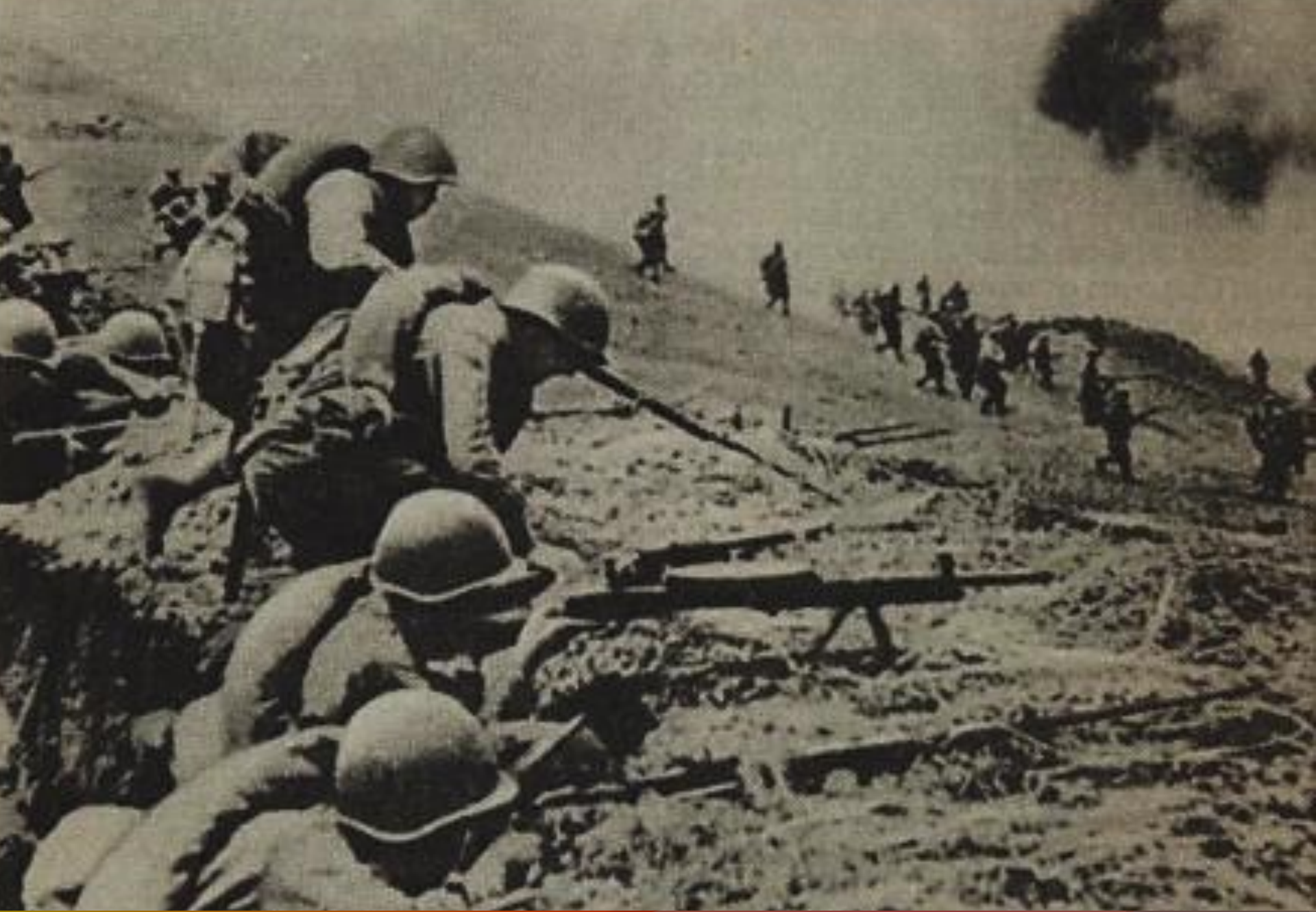
Из окопов поднимались в атаку