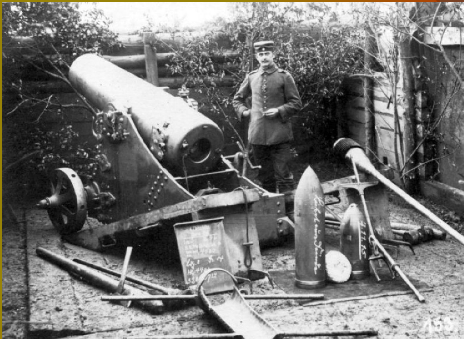
Окоп для орудия. (Английские войска, 1916 год)