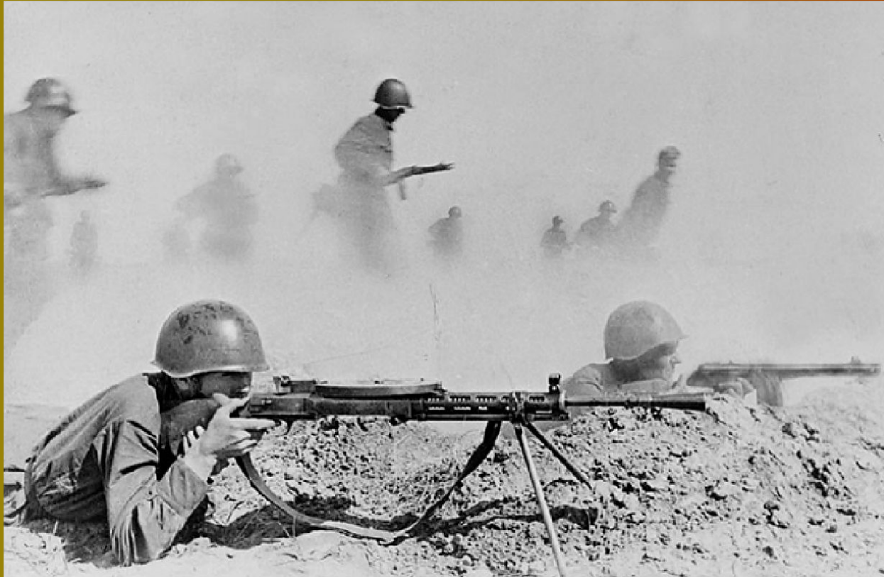
Бой на Сталинградском направлении. Лето 1942 года.