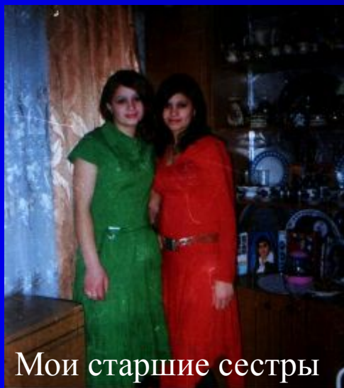
Мои старшие сестры

Все мне отвечали по-разному, но встречались и очень похожие трактовки понимания слова «счастье».