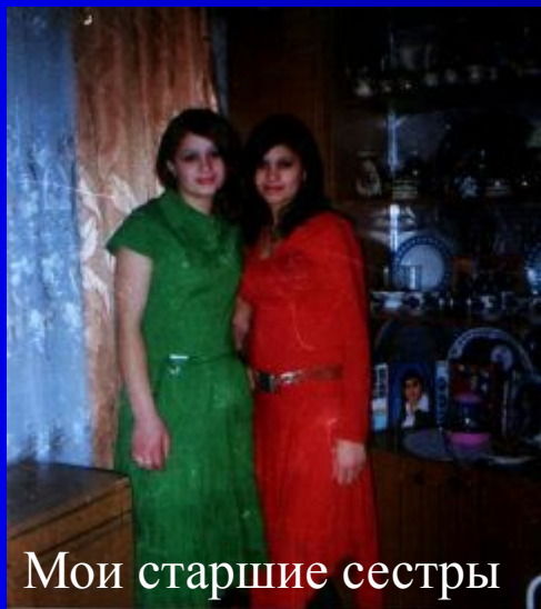
Мои старшие сестры

Все мне отвечали по-разному, но встречались и очень похожие трактовки понимания слова «счастье».