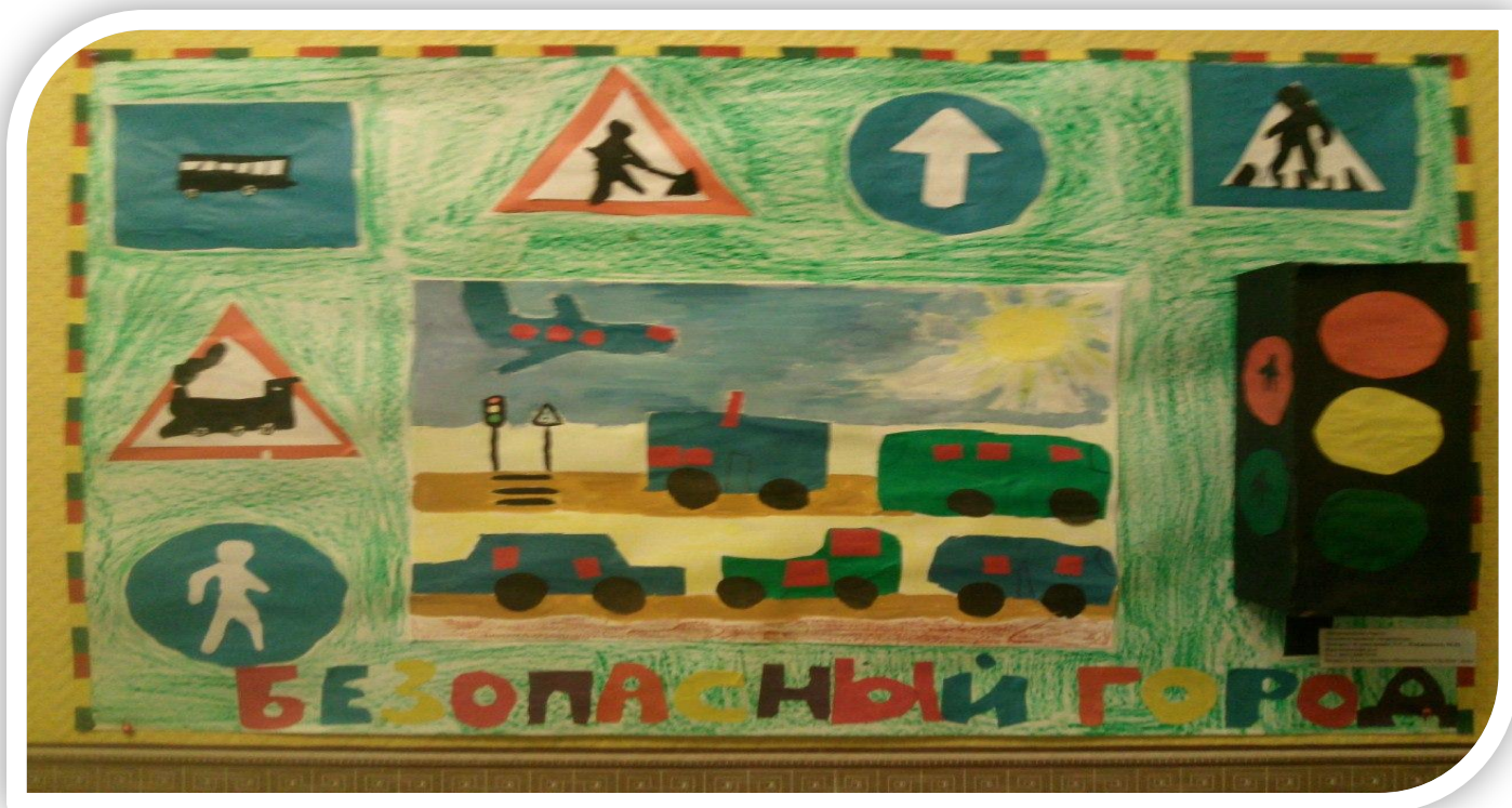
Коллективная работа средней группы 2010 учебный год.