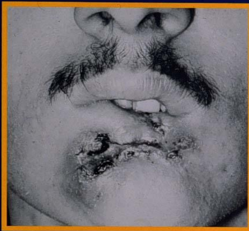
A fatal mouth cancer in a 28-year-old who dipped a can a day for 10 years.