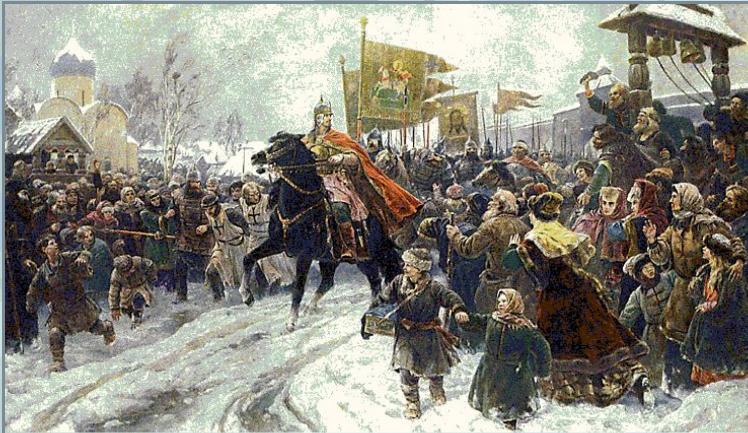
В. А. Серов. «Въезд Александра Невского во Псков»

Весной 1242 г. войско Ливонского рыцарского ордена попыталось вторгнуться в пределы русских земель. Русские дружины во главе с князем Александром Невским встретили агрессора на льду Чудского озера. Здесь 5 апреля 1242 г. произошло сражение, которое вошло в историю, под названием Ледового побоища.