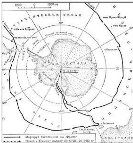
Маршрут Амундсена (Норвегия)

В октябре 1911 г. к Южному полюсу почти одновременно устремились две экспедиции - норвежская и британская. Цель экспедиций - впервые достичь Южного полюса.