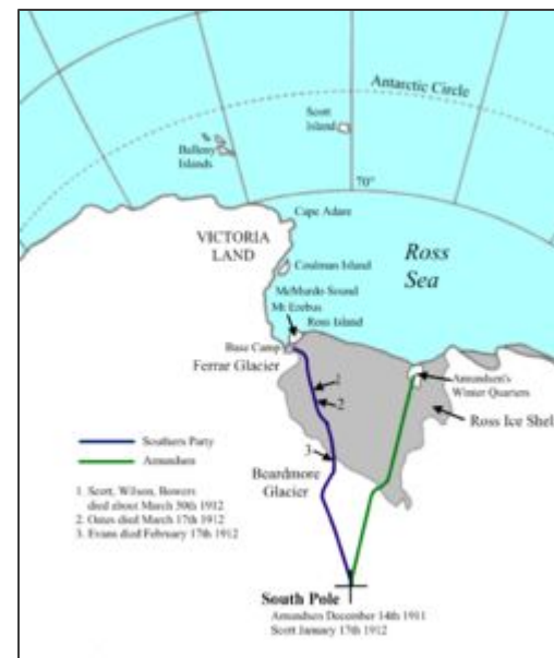
Маршрут Скотта (Англия)